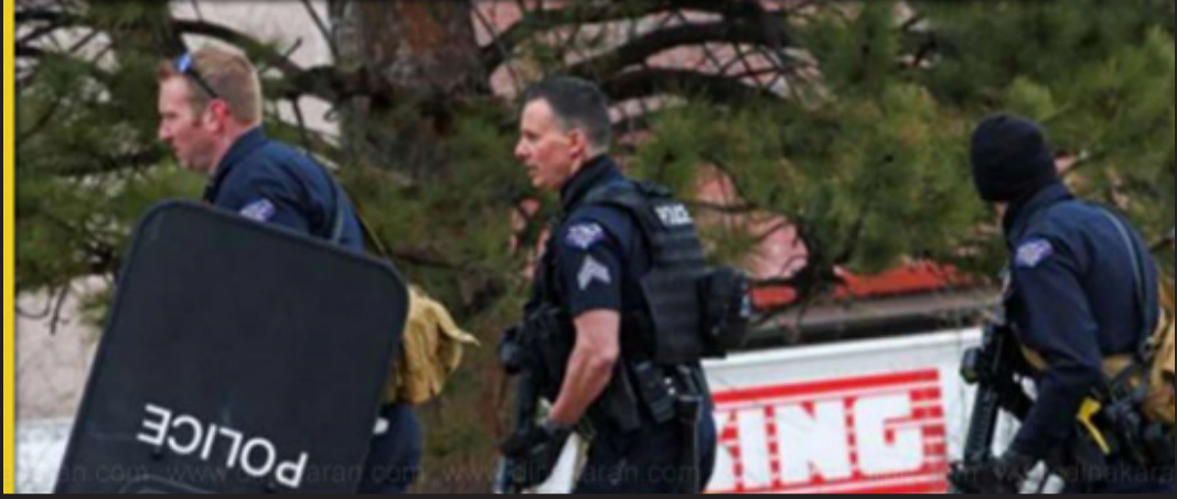
அமெரிக்காவில் சிகாகோ நகரில் நடந்த துப்பாக்கிச் சூட்டில் 5 பேர் உயிரிழந்தனர். மேலும் துப்பாக்கிச் சூட்டில் 16 பேர் காயம் அடைந்தனர்.