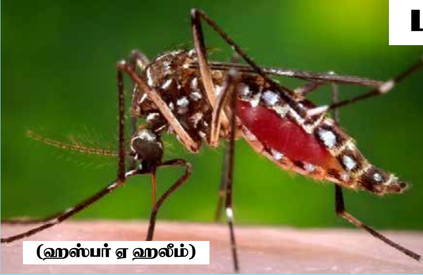
(ஹஸ்பர் ஏ ஹலீம்)