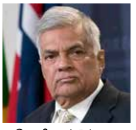
வெளிநாட்டுக் கடனை மறுசீரமைக்கும்

பிரதமர் ரணில் கூறுகிறார் கொழும்பு, ஜூன் 14 தற்போதைய நெருக்கடியிலிருந்து இலங்கை மீண்டு, நாட்டின் பொருளாதாரம் உறுதித்தன்மைக்கு வருவதற்கு சுமார் 18 மாதங்கள் எடுக்கும் என பிரதமர் ரணில் விக்கிரமசிங்க தெரிவித்தார். இலங்கை தற்போது பெரும் டொலர் நெருக்கடி மற்றும் கடன் பிரச்சனையை எதிர் கொண்டுள்ளது என்றும் அவர் குறிப்பிட்டார்.