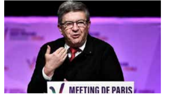
கிட்டும் என்றும் மெலன்சோன் செய்தியாளர்களிடம் கூறியிருக்கிறார்.

கடும் போக்கு இடதுசாரி ஜோன் லூக் மெலன்சோனால் உருவாக்கப்பட்ட “நியூப்ஸ்” என்னும் இடதுசாரிகள் கூட்டணி அதிகமான தொகுதிகளில் முதலிடம் பெற்றுள்ளது. ஆளும் கட்சிக்கும் அந்தக் கூட்டணிக்கும் இடையே சரிக்குச் சமனான கட்டுப்பாட்டி நிலவுவதை முடிவுகள் காட்டுகின்றன. மக்ரோனின் ஆளும் மூன்று கட்சிக் கூட்டணி பாராளுமன்றத்தில் அறுதிப் பெரும்பான்மை பெறுவதற்கு குறைந்தது 289 ஆசனங்களை வெல்ல வேண்டும். முதற்சுற்று மதிப்பீடுகளின்படி ஆளும் கட்சிக்கு 255 ஆசனங்களே கிடைக்கும் என்றும் மெலன்சோன் கூட்டணி 150 - 190 இடங்களைக் கைப்பற்றலாம் என்றும் கணிக்கப்படுகிறது. தீவிர வலது சாரி மரின் லூபென் கட்சி மூன்றாவது இடத்தில் 20-45 ஆசனங்களை வெல்லும் நிலையில் உள்ளது. நாடாளுமன்றத்தில் இடதுசாரி அவை வீசப்போவதை முடிவுகள் கோடி காட்டுவதாக தேர்தல் அவதானிகள் குறிப்பிடுகின்றனர். மக்ரோனின் கட்சி தாக்கப்பட்டுத் தோற்கடிக்கப்பட்டுள்ளது என்றும் இரண்டாவது இறுதிச் சுற்றில் தமது தரப்புக்கு மேலும் பெரும் வெற்றி