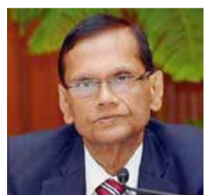
களுக்கு வழங்கியுள்ளதா கவும் அவர் கூறியுள்ளார். ஜக்கிய நாடுகள் மனித உரிமைகள் பேரவையின் 50ஆவது

● வெளிப்புற சாட்சிய சேகரிப்பை நிராகரிக்கிறோம் ● இராணுவ பிடியிலிருந்த 92வீத காணிகள் விடுவிப்பு ● பிரச்சனை தீர்வுக்காக பிரதமர், ஜனாதிபதி ஒருமிப்பு ஜெனிவா, ஜூன் 14 புலம்பெயர் சமூகத்துடன் இலங்கை திறந்த நிலையிலேயே உள்ளது. நாட்டின் ஜனநாயக விழுமியங்களையும் மனித உரிமைகளையும் பேணுவதில் முன்னேறியுள்ளது. இதேசமயம், அரசியலமைப்புக் கட்டமைப்புக்குள் மாற்றங்களை கூட்டாக ஏற்படுத்த முயல்கிறோம் என்று வெளிவிவகார அமைச்சர் ஜி. எல். பீரிஸ் தெரிவித்துள்ளார்.