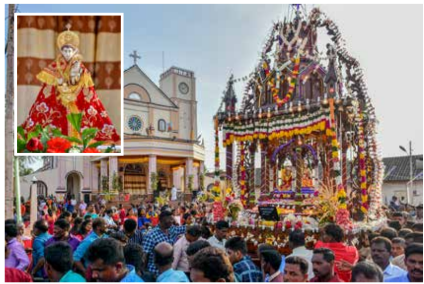
பிரசித்தி பெற்ற யாழ்ப்பாணம் - பாஷையூர் புனித அந்தோனியார் ஆலயப் பெருவிழா நேற்று வெகுவிமர்சையாக நடைபெற்றது. பதுவைப் புனிதரான அந்தோனியார் தேரில் ஏறி வீதி உலா வந்து பக்தர்களுக்கு ஆசிர வழுங்கினார். இந்நிகழ்வில் பல்லாயிரக்கணக்கான பக்தர்கள் அந்தோனியாரைத் தரிசிக்க வருகை தந்திருந்தனர்.

கொழும்பு, ஜூன் 14 இலங்கை சுற்றுலா அபிவிருத்தி அதிகார சபையில் பதிவுசெய்யப்பட்ட அனைத்து நிறுவனங்களுக்கும் மென்மையான மதுபான அனுமதிப் பத்திரங்களை வழங்க அமைச்சரவை அங்கீகாரம் வழங்கியுள்ளது. சுற்றுலாத்துறை மற்றும் காணி அமைச்சர் ஹரின் பெர்னாண்டோ இந்த விடயத்தை தனது சமூகவலைத் தளத்தில் பதிவிட்டுள்ளார். இது சுற்றுலாவை மேம்படுத்துவதற்கும் நாட்டுக்கு வெளிநாட்டு வருவாயையும் கொண்டு வரவும் உதவும். இலங்கையில் சுற்றுலாவுக்கு கிடைத்த பெரிய வெற்றி இது என்றும் அவர் கூறியுள்ளார்.