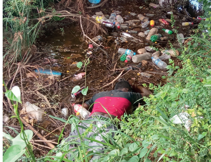
ரணலில் ரணலில், ஹிரான் பிரபகர டயக்ஸ்ஸூ

மதுரங்குளி நகரத்தில் உள்ள எரிபொருள் நிரப்பும் நிலையத்துக்கு டீசல் பெறுவதற்காக காத்திருக்கும் வாகனங்களுக்கு அண்மையிலுள்ள கானில் இருந்து, இனந்தெரியாத சடலமொன்று மீட்கப்பட்டுள்ளது. ஆண்மொருவரின் சடலம் கிடப்பதாக, மதுரங்குளி பொலிஸாருக்கு நேற்று (13) காலை கிடைத்த தகவலை அடுத்தே சடலம் மீட்கப்பட்டுள்ளது. எரிபொருள் நிரப்பும் நிலையத்தில் இருந்து 100 மீற்றர் தூரத்தில், டீசலை பெற்றுக்கொள்வதற்காக வரிசையில் நிறுத்தப்பட்டு இருக்கும் வாகனங்களுக்கு அண்மையிலுள்ள கானில் இருந்தே சடலம் மீட்கப்பட்டுள்ளது. இந்தச் சடலம் கிடக்கும் இடத்துக்கு அண்மையில் ஜீப் வாகனத்துக்கு அருகில் உடைந்த போத்தல்