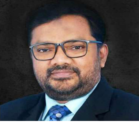
கல்முனை பிராந்திய சுகாதார சேவைகள் பணிப்பாளர் பிரிவுக்குட்பட்ட சாய்ந்தமருது சுகாதார வைத்தியகாரி