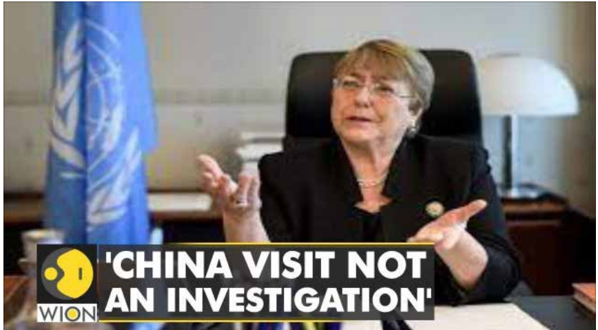
'CHINA VISIT NOT AN INVESTIGATION'

கடந்த ஆண்டு முதல் வெளியீட்டிற்காக காத்திருக்கும் இந்த அறிக்கை இப்போது புதுப்பிக்கப்பட்டு வருகிறது