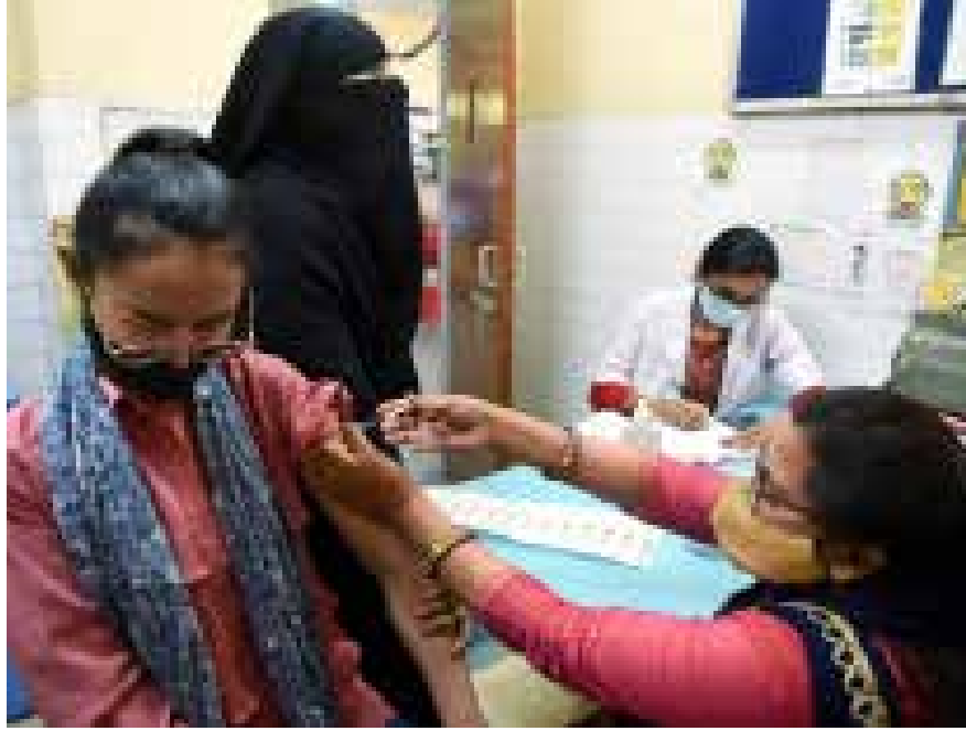
கொவிட் - 19 தடுப்பூசி ஜனவரி 16, 2021 அன்று தொடங்கியது.

இந்தியா முழுவதும் கொவிட் - 19 தடுப்பூசியின் வேகத்தை விரைவுபடுத்துவதற்கும் விரிவாக்குவதற்கும் மத்திய அரசு உறுதியூண்டுள்ளது. நாடு முழுவிய