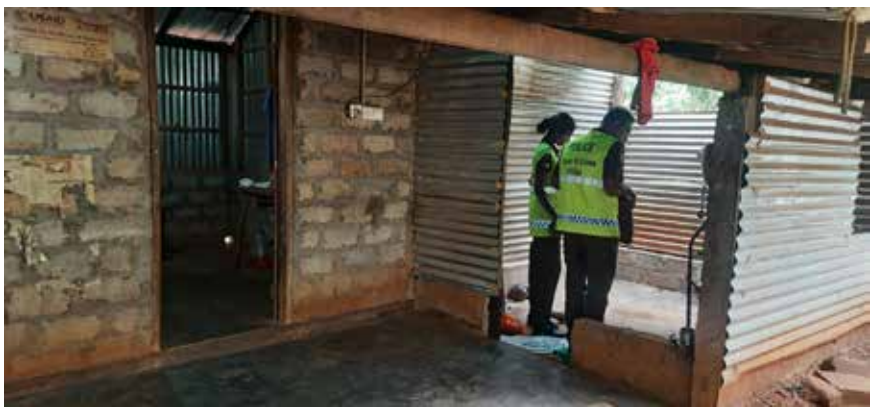
நபரே உயிரிழந்தவராவார். உயிரிழப்பு கொலை என்கிற ரீதியில்

காங்கேசன்துறை பொலிசார் விசாரணைகளை ஆரம்பித்துள்ள நிலையில் மரண விசாரணை அதிகாரி மற்றும் தடயவியல்