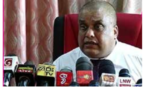
இது தொடர்பில் அவர் மேலும் கூறுகையில் -

கறுப்புச் சந்தையில் எரிபொருள் வர்த்தகத்தில் ஈடுபடும் மோசடிகாரர்கள் எரிபொருள்களைப் பதுக்கி வைப்பதால் இந்த மோசமான நிலை உருவாகியுள்ளதுடன், அவ்வாறானவர்களுக்கு எதிராக பொலிஸாரும் இராணுவத்தினரும் மௌனம் சாதிப்பதால், எரிபொருள் நிரப்பு நிலையங்களுக்குச் செல்லும் வைத்தியர்கள் மற்றும் சுகாதாரப் பணியாளர்கள் மிகவும் சிரமப்பட்டு வருகின்றனர் எனவும் அவர் மேலும் குறிப்பிட்டார்.