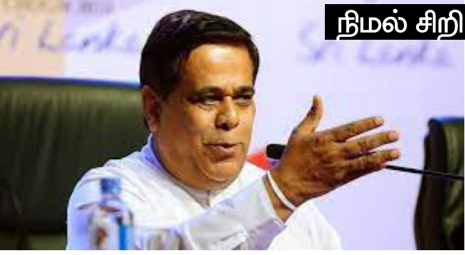
நிமல் சிறிபால டி சில்வா கூறுகிறார்

ஜனாதிபதி கோட்டாபய ராஜபக்ஷவுக்கும் பிரதமர் ரணில் விக்கிரமசிங்கவுக்கும் இடையில், தொடர்புகள் இல்லை என்பதை காணக் கூடியதாக இருப்பதாக முன்னாள் ஜனாதிபதி மைத்திரிபால சிறிசேன தெரிவித்துள்ளார். கொழும்பில் நடைபெற்ற செய்தியாளர் சந்திப்பின்