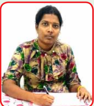
தொகுப்பு :- திருமலை தட்சாயினி ஞானசங்கரன்

நான் பாடசாலையில் படித்துக் கொண்டிருந்த வேளையில் எனது தோழனும் கழகப்புவர்