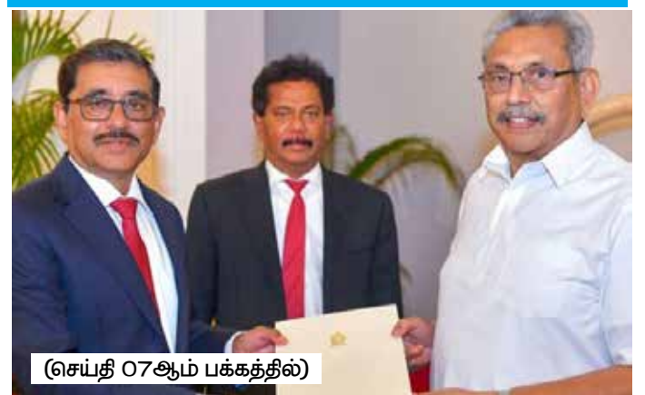
(செய்தி 07ஆம் பக்கத்தில்)