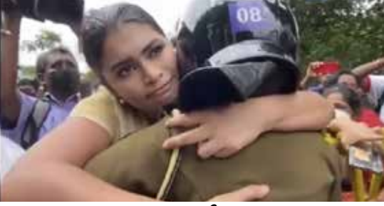
அதிகரிக்கும் விலைவாசி, பொருள்களின் தட்டுப்பாடு ஆகியவற்றுக்கு எதிர்ப்புத் தெரிவித்துப் பிரதமர்