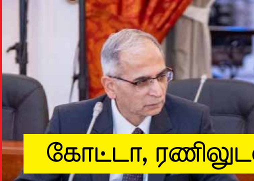
கோட்டா, ரணிலுடன் முக்கிய பேச்சு