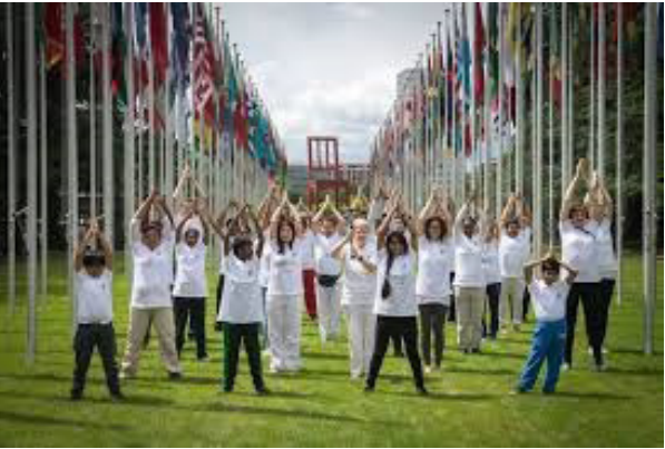
ஒட்டுமொத்த மனிதகுலத்தின் நலனுக்கான இந்