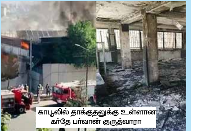
காபூலில் தாக்குதலுக்கு உள்ளான கர்தே பர்வான் குருத்வாரா

ஆப்கானிஸ்தானில் மத சிறுபான்மையினருக்கு எதிரான பிற தாக்குதல்கள் மற்றும் வன்முறை சம்பவங்கள்