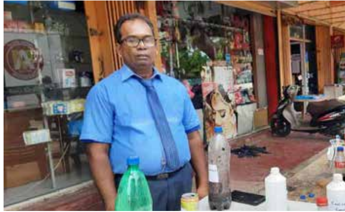
இலகுவாக கிடைக்கும் பொருள்களைக் கொண்டு பயோ பெற்றோல் மற்றும் பயோ டீசல் என்பவற்றை குறைந்த விலையில் உற்பத்தி செய்ய முடியும் என யாழ்ப்பாணத்தைச் சேர்ந்த ஓய்வு