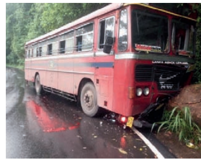
பிரதேசத்தைச் சேர்ந்த 39 வயதானவர் என்று கிணிகத்தேனை

இந்த விபத்தில் உயிரிழந்தவர் கிணிகத்தேனை, பல்லேவல