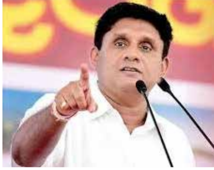
அரசுக்கு தெரியவில்லை எனவும் தெரிவித்தார்.

எதிர்வரும் போகத்தில் அறுவடை மூலம் ஐம்பது சதவீதம் வரை குறைவடையும் என நிபுணர்கள் கணிப்பு களை முன்வைப்பதாகவும் இது மிகவும் பாரதூரமான நிலை எனவும் எதிர்க்கட்சித் தலைவர் சஜித் பிரேமதாஸ தெரிவித்தார்.