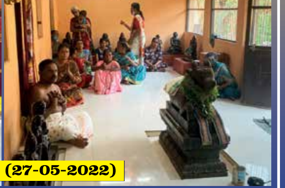
வைகாசி தென்னாடு இதழ் வெளியீடும் தேய்பிறை கழுவாய் வழிபாடும் (27-05-2022)