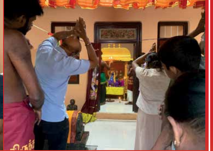
ஆனி நிறைமதிப் பூசை (15-06-2022)