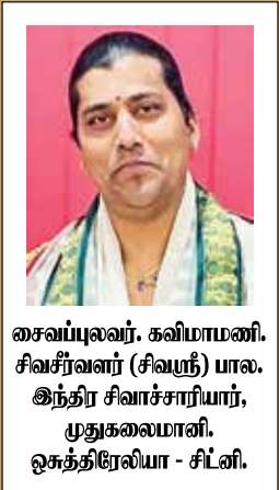
சைவப்புவலர், கவிமாமணி, சிவசீர்வளர் (சிவமூர்) பால, இந்திர சிவாச்சாரியார், முதுகலைமாணி, ஓசுத்திரேலியா - சிட்னி.