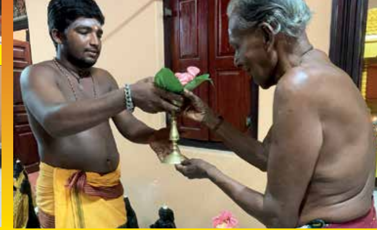
சீவதீக்கை (விசேடம்) வழங்கல் (19-06-2022)