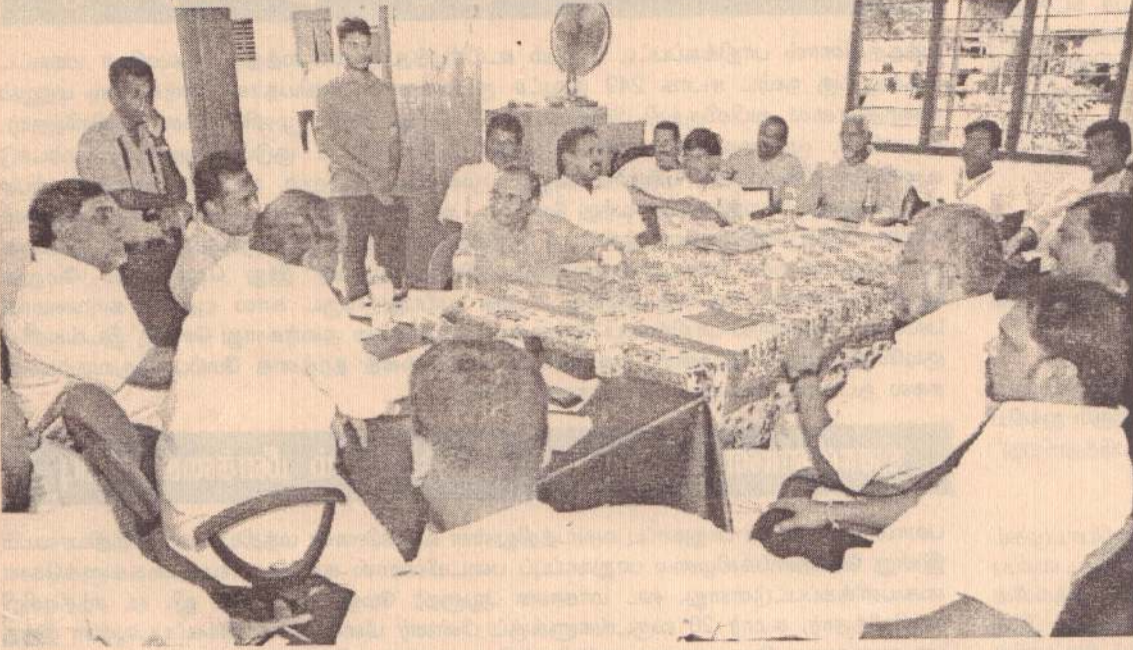
தமிழ் கட்சிகளின் அரங்கம் 03.10.2010 அன்று கிளிநொச்சியில் தமிழர் விடுதலைக் கூட்டணி காரியாலயத்தில் திரு.வீ.ஆனந்தசங்கரி அவர்களின் தலைமையில் நடைபெற்றது.

இக் கூட்டத்தில் அரசியல் தீர்வு பற்றிய விடயம் தனியாக விவாதிக்கப்பட வேண்டும். மக்களினதும், தமிழ் பிரதேசங்கள் தொடர்பிலான உடனடி பிரச்சினைகளுக்கு கூடுதல் முக்கியத்துவம் கொடுக்கப்பட வேண்டும் குறிப்பாக மீள்குடியமரும் மக்கள் எதிர்நோக்கும் பிரச்சினைகள் குறித்து ஆராய்ந்து நடவடிக்கை மேற்கொள்ள வேண்டும் என சமூகமளித்திருந்த கட்சிகளின் பிரதிநிதிகள் பலர் அபிப்பிராயம் தெரிவித்ததைத் தொடர்ந்து உடனடிப் பிரச்சினைகள் தொடர்பாக ஆராயப்பட்டு முடிவுகளும் எடுக்கப்பட்டது.