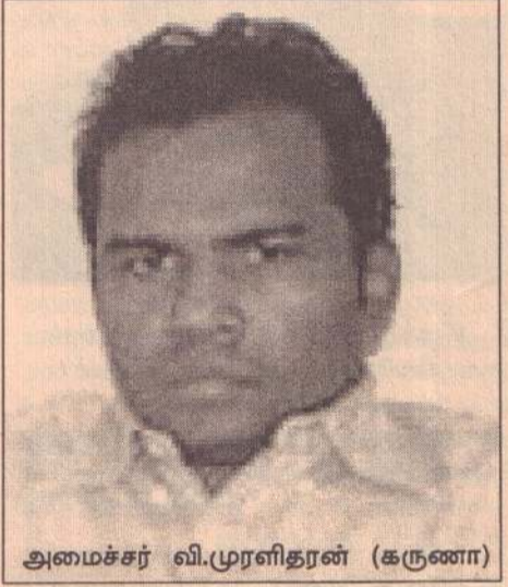
அமைச்சர் வி.முரளிதரன் (கருணா)

பல இடங்களில் இடம்பெயர்ந்து வாழ்ந்து வருபவர்கள் தொடர்பாக, இம் மாவட்டத்திலிருந்து இம் மாவட்டத்திற்குள் இடம் பெயர்ந்தவர்களினதும், இலங்கையிலிருந்து இந்தியாவிற்கு அகதியாக சென்று மீண்டும் இலங்கை வந்து மீள்குடியமர்ந்தவர்களினதும்,