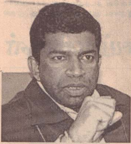
கிழக்கு மாகாண முதலமைச்சர் சிவநேசதுரை சந்திரகாந்தன்

நல்லாட்சி, வெளிப்படைத்தன்மை, வன்முறை யற்ற தன்மை, ஊழல் அற்ற நிர்வாகம் என்பன