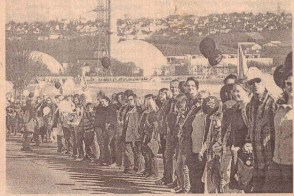
ஜெர்மனியில் அனுமின் நிலையங்களை இல்லாமல் செய்வதற்கான எதிர்ப்பு நடவடிக்கையில் 60 ஆயிரத்திற்கும் மேற்பட்டவர்கள் பங்குகொண்ட 45 கிலோமீற்றர் நீளமான மனிதச் சங்கிலி பேராட்டத்தில் பங்குகொண்டுள்ள மக்கள்

அது மக்கள் மத்தியில் பல்வேறு கால கட்டங்களில் பல்வேறு விழிப்புணர்வு பேராட்டங்களை நடத்தி வந்திருக்கின்றது. ஐப்பானில் அண்மையில் ஏற்பட்ட நிகழ்வைத் தொடர்ந்து ஜெர்மனியில் பல பாகங்களிலும் மக்கள் தமது எதிர்ப்பு