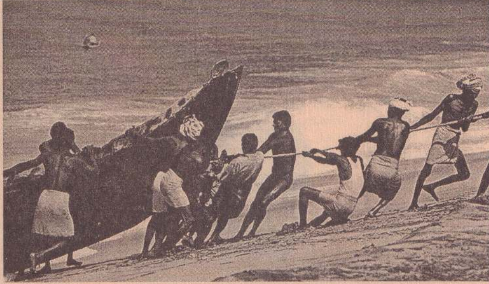
கடந்த வந்த முப்பது வருடங்களில் மீனவர்கள் மோசமாக பாதிக்கப்பட்டிருக்கிறார்கள். அன்றாடம் அடி, உதை, அகதி வாழ்வு அரைவயிற்று கஞ்சிக்காக அலையும் நிலை ஏற்பட்டது. யுத்தம்- சுனாமி-வேறு இயற்கை அனர்த்தங்களாலும் பிரமாண்டமான அளவில் உயிரழிவுகள் நிகழ்ந்திருக்கின்றன.

மக்களிடையே சகோதரத்துவம், கல்வி, சுகாதாரம், குடியிருப்பு பிரச்சனைகளில் அக்கறை செலுத்தப்பட வேண்டும். பிராந்திய அளவில் இந்த நடவடிக்கை-