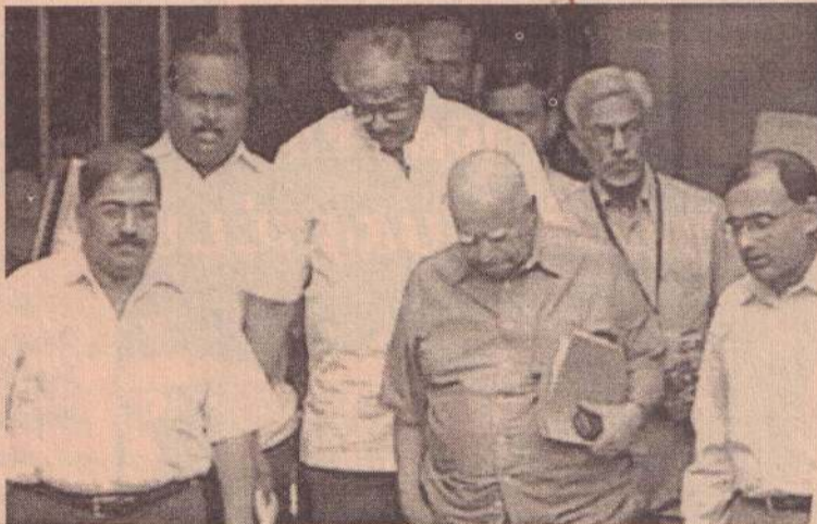
தமிழ் தேசிய கூட்டமைப்பில் இணைந்துகொண்ட அனுபவம் வாய்ந்த தலைவர்களான ஆனந்தசங்கரி, சித்தார்த்தன் ஆகியோரை பேச்சுவார்த்தைகளில் கதம்பகாரர்கள் இணைத்துக்கொள்ளவில்லை.

இன உரிமைக்கான கடந்த 30 வருடங்களுக்கு மேற்பட்ட செயற்பாட்டில் மழைக்குக்கூட ஒதுங்காத சுமந்திரன் போன்றவர்களை இணைத்துக் கொண்டு