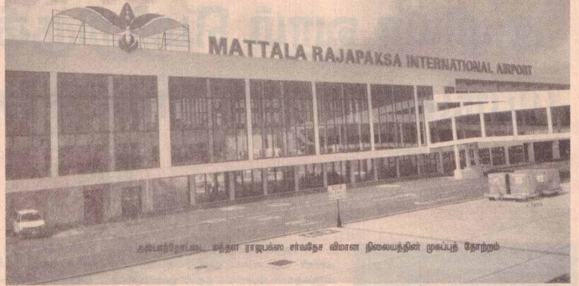
அம்பாந்தோட்டம், மத்தள ராஜபக்ச சர்வதேச விமான நிலையத்தின் முகப்புத் தோற்றம்

அம்பாந்தோட்டையில் துறைமுகம், மத்தள விமான நிலையம், கிழக்கில் ஒலுவில் துறைமுகம், கொழும்பில் துறைமுக நகரம் என நாட்டின் இதர பகுதிகளில் புதிதாக துறைமுகங்களும், விமான நிலையங்களும் உருவாக்கப்பட்டுக்கொண்டிருக்கும் அதே வேளை யுத்த காலத்துக்கு முன்னர் இலங்கையிலேயே இரத்தமலாணை, கட்டுநாயக்கா ஆகிய இடங்களுக்கு அப்பால் பயணிகளுக்கான விமான நிலையமாக இருந்தது பலாலி விமான நிலையம் மட்டும் தான்.