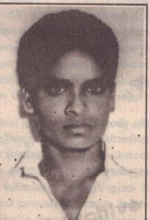
தோழர் குணம் கல்லாறு