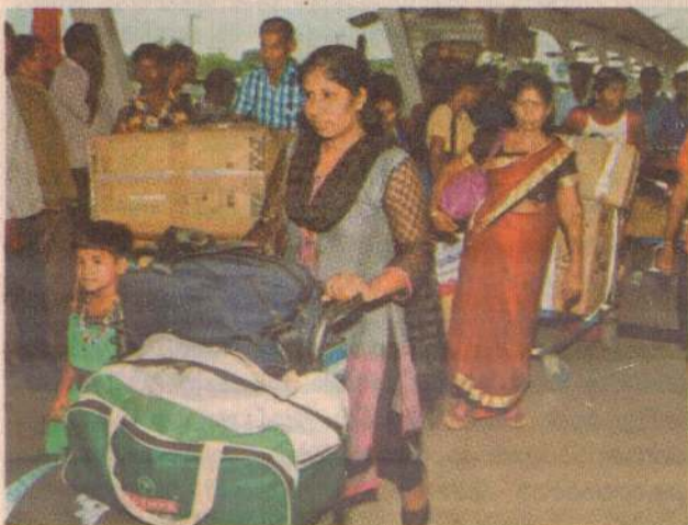
தமிழகத்திலிருந்து நாடு திரும்பும் இலங்கை அகதிகள், 2016

சென்னை புலம், கும்பிடிப்புண்டி போன்ற முகாம்கள் அமைந்துள்ள இடங்கள் பெரும் தொழில் பேட்டைகளைக் கொண்டுள்ளதால், அங்கு சீமெந்து குடோன்களிலும், வெங்காய குடோன்களிலும் வேலை செய்கிறார்கள். சிலர் மேசனர்களாகவும் பெரும்பாலானவர்கள் கூலிகளாகவும் உள்ளனர். பல முகாம்களில் உள்ளவர்கள் வீடுகளுக்கு வர்ணம் பூசும் வேலைகளைச் செய்கிறார்கள். படித்தவர்கள் கூட தங்களுக்கு உரிய வேலை