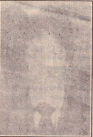
தோழர் ரஞ்சித் கனுவன்கேணி