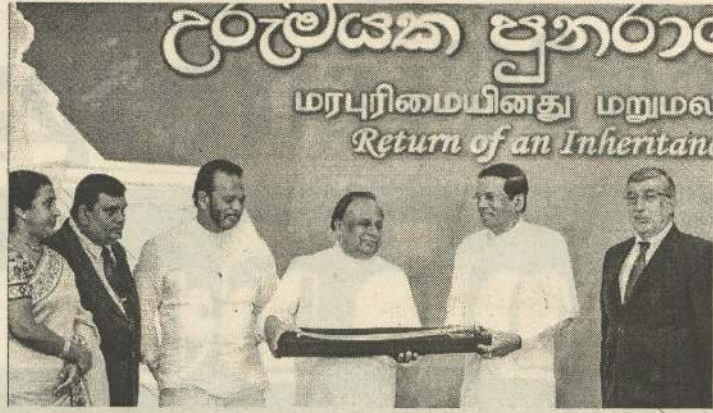
Return of an Inheritance மரபுரிமையினது மறுமலர்

தொல்லியல் பெறுமதியுடன் கூடிய இந்த வாள் கண்டி யுகத்துக்கு