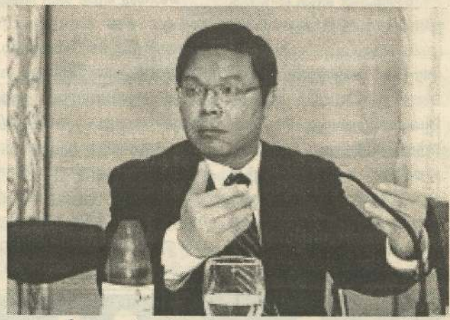
வக்கு மீளசெலுத்த வேண்டிய கடன் தவணைக் கட்டணங்களை இலங்கை உரிய முறையில் செலுத்தி வருகிறது. எனவே, இலங்கைக்கு சீனா தொடர்ந்தும் உதவும் என்றும் சீனத் தூதுவர் தெரிவித்தார். (இ-7)