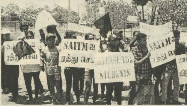
மருத்துவ பீடத்திற்கு எதிர்ப்புத் தெரிவித்தே நாட்டில் போராட்டங்கள் இடம்பெற்று வருகின்றமை குறிப்பித்தக்கது. (8-312)

சைட்டம் தனியார் பல்கலைக்கழகத்தில் மருத்துவ பீடம், பொறியியல் பீடம், சட்டத்துறை பீடம் என பல பீடங்கள் உள்ள போதும்,