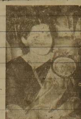
செயற்படுத்தவேண்டும் என்று கோரி தமிழக முதலமைச்சர் ஜெயலலிதா நேற்று காலையில் இருந்து காலவரையற்ற

செயற்படுத்தவேண்டும் என்று கோரி தமிழக முதலமைச்சர் ஜெயலலிதா நேற்று காலையில் இருந்து காலவரையற்ற.