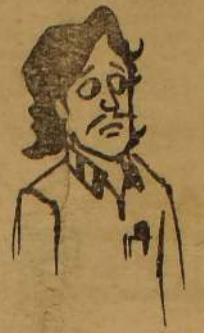
அப்ப, தமிழ் அரசாங்க விடுதலைப் போராட்டம் கதிர்வரலின், இரண்டாம் நாட்களில் அரசாங்கப் பந்தர்கள் வந்து இருக்கும் என்று கூசாமல் சொல்லலாம். பி.கே. 1