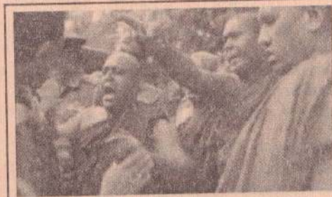
தம்புள்ளியில் பள்ளிவாசலை அகற்றக் கோரி ஆர்ப்பாட்டம் 20 ஏப்ரல் 2012

மதகலாச்சார நம்பிக்கைகள் மீதும் நிர்ப்பந்தங்கள் ஏற்படுத்தப்பட்டுள்ளன.