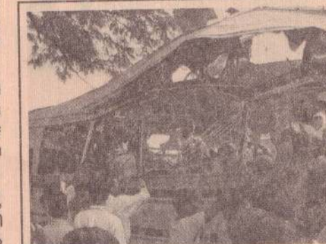
தம்புள்ளியில் பயணிகள் பல மீது புலிகள் தாக்குதல் 18 பேர் பலி 02 பெப்ரவரி 2008

இலங்கையில் மீண்டும் மீண்டும் அறங்கள் அழிந்து வருகின்றன.