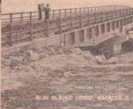
கலு கல்குடும் பாலம் சபரூப்பிடம்

ஆற்று ஓட்டங்கள் கடக்கும் பாலங்கள் நவீன தொழில் நுட்பங்களுடன் கட்டப்பட்டுள்ளன.