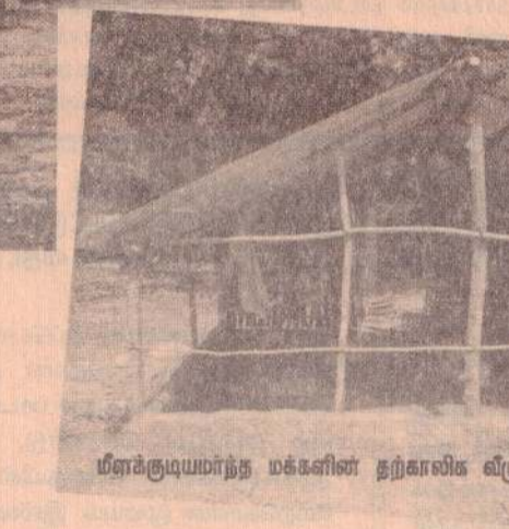
மீள்குடியமர்ந்த மக்களின் தற்காலிக வீடு, மாதகல் மேற்கு

இவ்வாறான முக்கியமான விடயங்கள் இந்த ஆண்டுக்குள் நிறைவேற்றி முடிக்கப்படும் வகையில் நடைமுறையாக வேண்டும் என எல்லா அரசியற் தலைவர்களும் திடீச்சங்கற்பத்துடன் செயற்பட வேண்டும். அதுவே அவர்களை நம்பியிருக்கும் சமூகத்துக்குச் செய்யும் குறைந்தபட்ச தொண்டு.