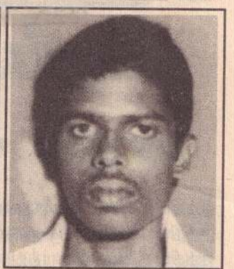
தோழர் செல்வரின் இடைக்காடு