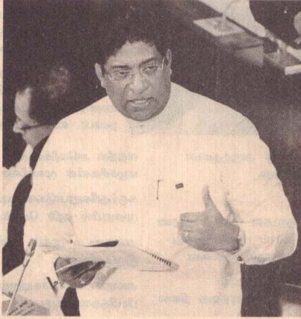
பாராளுமன்றத்தில் நிதி அமைச்சர் ரவி கருணநாயக்க

களை ஏற்படுத்தும் விதமாக அரசு மற்றும் தனியார் துறைகளில் அதிகரித்த முதலீடுகள் இடப்படுவதற்கான அபிவிருத்தி வழிகள் திறக்கப்படும்