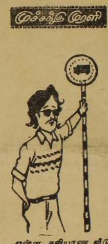
சென்னை, கலியாண வீடு கடை மரண வீடுகளைக் கிற சாதாரண இப்ப நடந்து கொண்டிருக்கிற பாத்திரம். எல்லா தாக்குதல் ஒரு முடிவு விடவு வராமலா போகும்...

கும்புறுப்பிட்டி கிராம சேவையாளர் சுட்டுக் கொலை