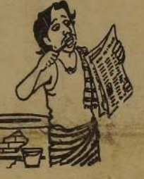
சலுகையிலைவந்ததுதானே சலுகையாய் வித்து விடுவம் என்று யோசிச்சுச் செய்திட்டினம் யோலை மக்கள் தலைவர்கள்...

நோன்பு தீர்க்கும் நேரம் 6-4-90 வலவர் முடிவு - 4 - 32 நோன்பு தீர்க்கும் நேரம் - 6 - 21