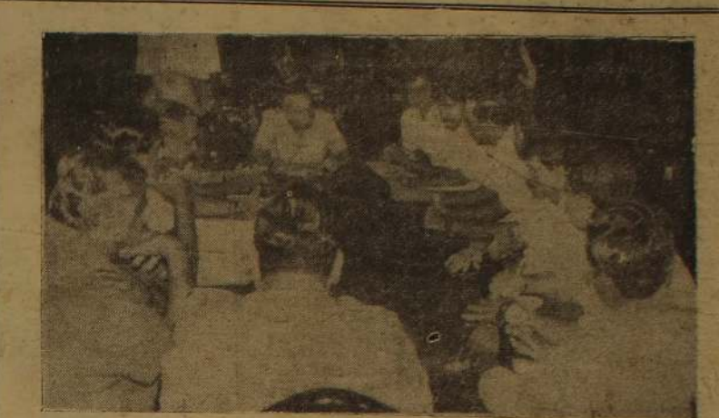
தமிழ் விடுதலைப் புலிகளுக்கும் இலங்கை அரசின் பிரதிநிதிகள் மற்றும் மூப் படைத் தளபதிகள், பொலீஸ்மா அதிபர் ஆகியோருக்கும் இடையில் கொழும்பில் செவ்வாய்க்கிழமை நடைபெற்ற பேச்சுவார்த்தையின் போது எடுக்கப்பட்ட படம். வடக்கு - கிழக்கில் சட்டம் ஒழுங்கு நிலைமை குறித்து இந்தச் சந்திப்பின் போது ஆராயப்பட்டது.

இப்பகுதிகளில் தொடர்ந்து விடுதலைப்புலிகளுடன் நல்லு றவைப் பேண நடவடிக்கை எடுக்கப்படும் எனவும் அந்த அதிகாரி சொன்னார்.