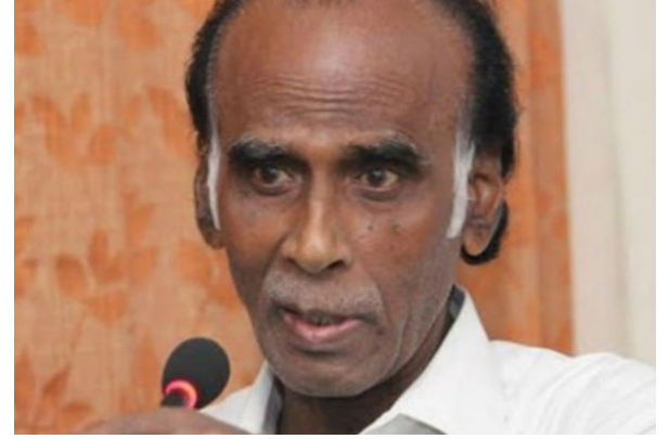
சுக்கு உதவுவது என்பது பாம்புக்குப் பால் வார்த்த கதை ஆகிவிடும்.

அதனால், இந்தியா இலங்கைக்கு உதவி செய்ய நினைத்தால், அங்குள்ள ஈழத்தமிழர்களுக்கு வடக்கு கிழக்கு மாகாணத்தைக் கொடுத்து ஆட்சி அதிகாரத்தை அவர்களே அமைத்துக்கொள்ளும் வகையில் அவர்களுக்கு சகல உரிமைகளையும் வழங்க வேண்டும் என்ற நிபந்தனையை விதிக்க வேண்டும். அதற்கு சம்மதித்தால் உதவலாம். இல்லையென்றால் இலங்கை அரசுக்கு உதவுவது என்பது பாம்புக்குப் பால் வார்த்த கதை ஆகிவிடும்.