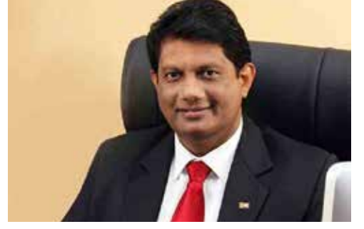
எதிர்ப்பு தெரிவித்து வீதிக்கிறங்குவார்கள்.

ஜனாதிபதியும் நாட்டு மக்களுக்கு உரையாற்றுவதில்லை. பிரச்சினைக்குத் தீர்வு காண அவதானம் செலுத்தாமல் இருந்தால் நாட்டு மக்கள் மீண்டும் அரசாங்கத்துக்கு