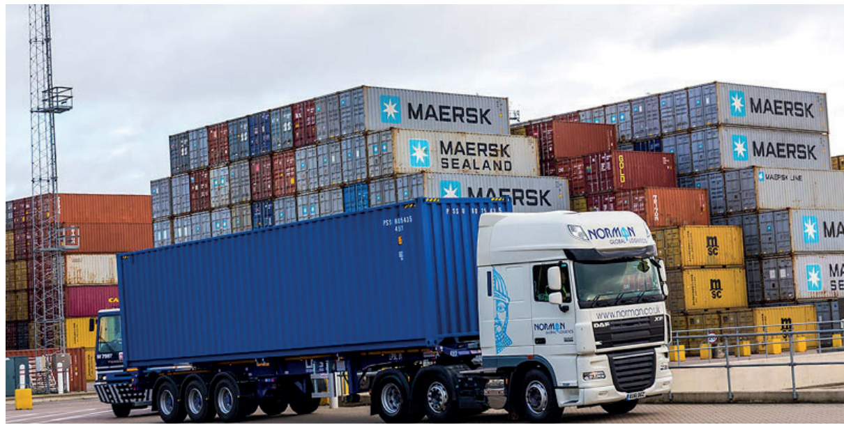
கொள்கலன் போக்குவரத்துக் கட்டணம்

இலங்கையில் திட்டமிடப்பட்டுள்ள இயற்கைத் திரவ எரிவாயுத் திட்டங்கள் (LNG) மற்றும் அவற்றின் தற்போதைய நிலைமைகள் குறித்து விளக்கமளித்த அமைச்சின் அதிகாரிகள், இந்த அகழ்வாராய்ச்சிகளுக்குப் பல்வேறு தடைகள் இருப்பதாகவும் சுட்டிக்காட்டினர். எனினும் இந்த வேலைத்திட்டங்களை முன்னெடுக்க வேறு நாடுகளின் ஆலோசனைகள் தேவையில்லை என்றும் அதிகாரிகள் தெரிவித்தனர். இதற்கமைய இந்த அகழ்வுகள் விரைவில் மேற்கொள்ளப்பட வேண்டும் என்றும், நாட்டின் தேவைக்குப் பயன்படுத்தக் கூடிய வகையில் இந்த அகழ்வுகளை மேற்கொள்வதற்கான வழிகாட்டல்கள் விரைவில் தயாரிக்கப்பட வேண்டும் என்றும் கோபா குழு ஆலோசனை வழங்கியது.