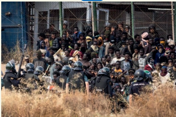
மேற்பட்டவர்கள் படுகாயமடைந்துள்ளனர் எனவும், இச் சம்பவத்தால் ஸ்பெயின்-மொராக்கோ எல்லையில் பதற்றமான சூழல் நிலவி வருவதாகத் தெரிவிக்கப்பட்டுள்ளது.

ஸ்பெயின் நாட்டில் அமைந்துள்ள மெல்லிலா நகரத்திற்குள் நுழைவதற்காக மொராக்கோ நாட்டின் எல்லையில் ஆபிரிக்க நாடுகளைச் சேர்ந்த இரண்டாயிரத்திற்கும் அதிகமான அகதிகள் குவிந்துள்ளனர். இந்நிலையில் அப்பகுதியில் பணியில் இருந்த மொராக்கோ எல்லை பாதுகாப்பு படை வீரர்கள் அகதிகளை அங்கிருந்து வெளியேற்றுவதற்கு முயற்சி செய்துள்ள நிலையில், இரு தரப்பினருக்கும் மோதல் ஏற்பட்டதாகத் தெரிவிக்கப்படுகிறது. இம் மோதலைப் பயன்படுத்தி நூற்றுக்கணக்கான அகதிகள் எல்லையில் உள்ள வேலியை தாண்டி மெல்லிலா நகருக்குள் செல்ல முயற்சித்த நிலையில், அங்கு ஏற்பட்ட கூட்ட நெரிசலில் சிக்கிய அகதிகளில் 23 பேர் பரிதாபமாக உயிரிழந்துள்ளனர். மேலும் 70க்கும்