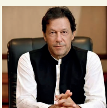
எனினும் தனது ஆட்சி அந்நிய சக்திகளின் சதியால் கவிழ்க்கப்பட்டது என தொடர்ந்து கூறி வரும் இம்ராள் கான், நாடு முழுவதும் மக்களை சந்தித்து கூட்டம் நடத்தி ஆதரவு திரட்டி வருவதோடு, போராட்டங்களிலும் ஈடுபட்டு வருகின்றார். இந்நிலையில்

பாகிஸ்தான் தெற்கு இ இன்சாப் கட்சியின் தலைவரும் அந்நாட்டின் முன்னாள் பிரதமருமான இம்ராள் கானின் இல்லத்தில் பணியாற்றும் ஊழியர் ஒருவர், இம்ராள் கானின் படுக்கை அறையில் உளவு பார்க்கும் கருவியை பொருத்த முயற்சி செய்த சம்பவம் பெரும் பரபரப்பை ஏற்படுத்தியுள்ளது. பாகிஸ்தானில் கடந்த ஏப்ரல் மாதம் இம்ராள் கானின் ஆட்சி கவிழ்க்கப்பட்டு, அவர் பிரதமர் பதவியில் இருந்து நீக்கப்பட்டார். இதையடுத்து எதிர்க்கட்சிகள் ஒன்றிணைந்து அமைக்கப்பட்ட ஆட்சியில் முன்னாள் பிரதமர் நவாஸ் ஷெரிப்பின் சகோதரர் ஷேபால் ஷெரிப் புதிய பிரதமராகத் தெரிவு செய்யப்பட்டார்.