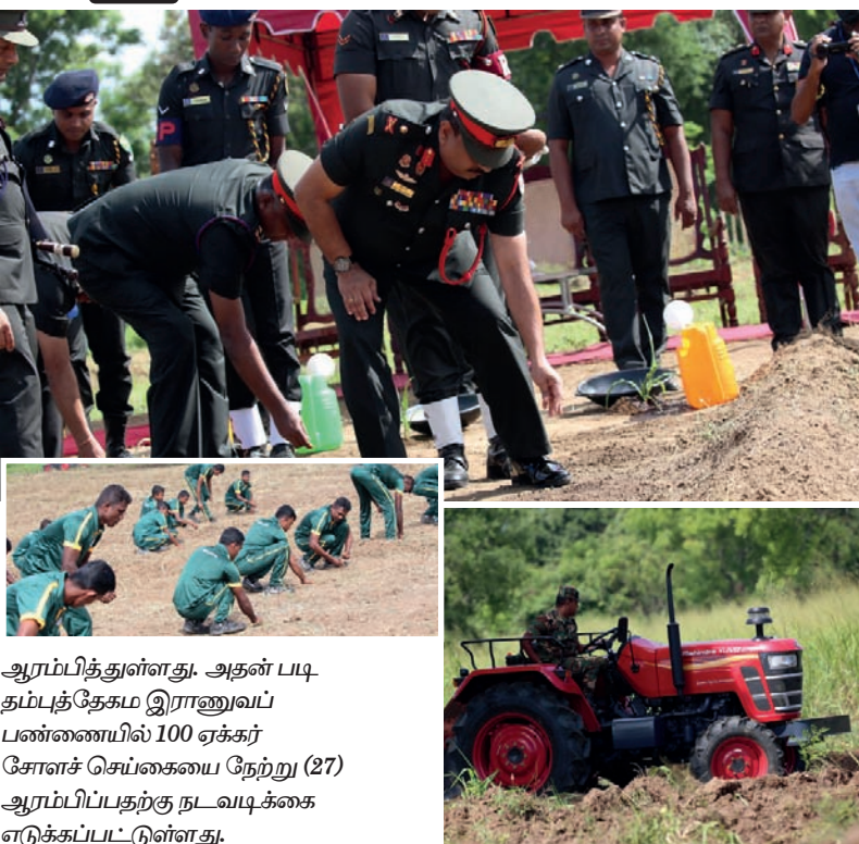
ஆரம்பித்துள்ளது. அதன் படி தம்புத்தேகம் இராணுவப் பண்ணையில் 100 ஏக்கர் சேளச் செய்கையை நேற்று (27) ஆரம்பிப்பதற்கு நடவடிக்கை எடுக்கப்பட்டுள்ளது.

இலங்கை இராணுவ பசுமை விவசாய செயற்பாட்டு குழுவை தற்போதைய இராணுவத் தளபதி லெப்டினன் ஜெனரல் விக்கும் வியனேசு அண்மையில் ஆரம்பித்து வைத்தார். இலங்கை இராணுவ விவசாயம் மற்றும் கால்நடை பணிப்பகம் மற்றும் இலங்கை இராணுவ விவசாய மற்றும் கால்நடை பணியினால் நாடளாவிய ரீதியில் 16 இராணுவப் பண்ணைகளில் விவசாயம் மேற்கொள்ளப்படுகின்றது. 1,063 ஏக்கர் நிலப்பரப்பில் அரசுக்கு சொந்தமான விவசாயம் மேற்கொள்ளாத நிலப்பரப்பில் விவசாயம் மேற்கொள்வதற்கான நடவடிக்கையினை இலங்கை இராணுவம் மேற்கொள்ளும் திட்டத்தை ஆரம்பித்துள்ளது. இலங்கையில் உணவுப் பாதுகாப்பை மேம்படுத்தும் நோக்கில் இதன் முதற்கட்டமாக 500 ஏக்கர் நிலப்பரப்பில் சேளப்பயிர் செய்கையை இலங்கை இராணுவம்