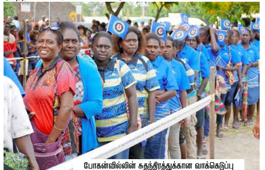
போகன்வில்லின் சுதந்திரத்துக்கான வாக்கெடுப்பு