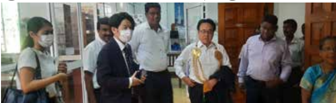
(கலையமுதன்) தூதுவர் மிசுகோஷி ஹிடேசி யாழ்ப்பாணம், ஜூன் 30 இலங்கைக்கான ஜப்பான் பொதுசன