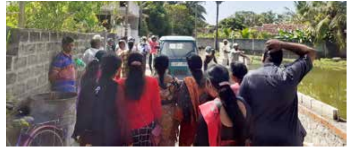
(காரைதீவு நிருபர் சகர) கல்முனை வடக்கு பிரதேச செயலக எல்லைக்குட்பட்ட அரசு காணிக்குள் தனியார் ஒருவர் அத்துமீறி நுழைந்து கட்டுமான வேலைகளை