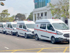
டீசலைப் பெறுவதற்கு விசேட பொறிமுறையினை ஏற்படுத்தியுள்ளார். அதனால் முல்லைத்தீவில் சும்பர் டீசலில் இயங்கும் நோயாளர் காவலு வண்டிகள் தொடர்ந்து பாவணையில் உள்ளன.

மத்திய சுகாதார அமைச்சால் 46 பென்ஸ் மற்றும் போட்டோ ரக நோயாளர் காவலு வண்டிகள் வடமாகாணத்துக்கு வழங்கப்பட்டிருந்தன. இவற்றிற்கு உற்பத்தியாளர்களால் வழங்கப்பட்ட உத்தரவாதத்தின் படி சும்பர் டீசல் மட்டுமே பயன்படுத்தப்பட வேண்டும். ஆனால், தற்போதைய நெருக்கடியான சூழ்நிலையில் இவற்றிற்கான சும்பர் டீசலைப் பெறுவதில் சுகாதார பிரிவினர் சும்பர் டீசலில் இயக்க வேண்டிய நோயாளர் காவலு வண்டிகளை சுகாதார திணைக்களம் எதிர்கொண்டுள்ளது. இதனால் சில மாவட்டங்களில் குறித்த நோயாளர் காவலு வண்டிகள் தற்காலிகமாக பாவணையில் இருந்து விலக்கப்பட்ட நிலையில் இருப்பதாக சுகாதார தரப்பினர் தெரிவிக்கின்றனர். இந்த நிலையில், முல்லைத்தீவு மாவட்ட சுகாதார பணிப்பாளர் தமது மாவட்ட அரசு அதிபர் ஊடாக சும்பர்