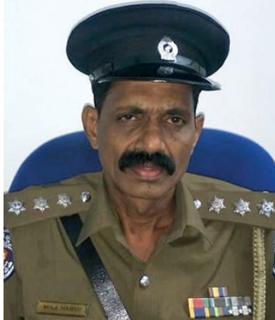
வீதியோரங்களில், பொது இடங்கள், வியாபார நிலையங்களில் நிறுத்தி வைக்கப்படும் சைக்கிள்களை அதன் உரிமையாளர்கள் பாதுகாப்பான