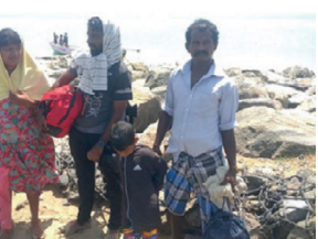
தங்க வைக்கப்பட்ட உள்ளனர். இவர்கள், வவுனியாவில் இருந்து மன்னாருக்கு வந்து, மன்னாரில் இருந்தே படகு மூலம் தனுஷ்கோடியை சென்றடைந்துள்ளதாக தெரிவித்தனர்.

இலங்கையில் ஏற்பட்டுள்ள சூழ்நிலை காரணமாக, வவுனியா மாவட்டத்தில் இருந்து நாஸ்து பேர், அகதிகளாக தனுஷ்கோடியை நேற்றுக்காலை சென்றடைந்துள்ளனர். இவர்களை மீட்ட கரையோர பொலிஸார் இராமேஸ்வரம் கரையோர காவல் நிலையத்துக்குக் அழைத்துச் சென்றுள்ளனர். விசாரணைக்குப் பின்னர், மண்டபம் அகதிகள் முகாமில்