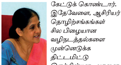
அதிபர்களும் ஆசிரியர்களும் இந்த விடயத்தில் ஒத்துழைக்க வேண்டும்.