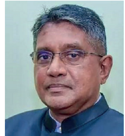
வட மாகாணத்தில் செயற்பாடின்றி மக்களை சிரமத்துக்கு உள்ளாக்கும் எந்த ஒரு நிர்வாக கட்டமைப்பையும் ஆளுநர் என்ற நிலையில் அனுமதிக்கப் போவதில்லை. ஆகவே, வடக்கு மாகாணத்தில் இதுவரை அமைச்சுகள், திணைக்களங்களுக்கு வழங்கப்பட்ட முறைப்பாடுகள் தொடர்பில் தீர்வு முன் வைக்காதவர்கள் மீது நடவடிக்கை எடுக்க தயக்க மாட்டேன் என ஆளுநர் எச்சரிக்கை விடுத்தார்.

பெற்றுக் கொள்ளாமல், அமைச்சுகள், திணைக்களங்களில் இடம்பெற்ற முறைகேடான செயற்பாடுகள் தொடர்பிலும் பல முறைப்பாடுகள் நேரடியாக கிடைக்கப்பெற்றன. அவ்வாறு கிடைக்கப்பெற்ற முறைப்பாடுகளில் சிலவற்றுக்கு இதுவரை அமைச்சுகள், திணைக்களங்கள் நடவடிக்கை எடுக்காமல் தொடரில் எனது கவனத்துக்குக் கொண்டுவரப்பட்டுள்ளது. அரசு சூற்று நிரூபணங்களுக்கு அமைவாக முறைப்பாடு வழங்கும் நபர் ஒருவருக்கு உரிய காலப் பகுதியில் தீர்வை முன்வைக்க வேண்டியது பொறுப்பு வாய்ந்த அதிகாரிகளின் கடமையாகும். அரசு நிர்வாகம் பொது மக்களின் தேவைகளை இலகுவாகக் கட்டியமைக்கப்பட்ட ஸ்தாபன அமைப்பாக காணப்படுகின்ற நிலையில், அதன் ஊடாக பொதுமக்களின் தேவைகள் நிறைவேற்றப்படும் போதே குறித்த ஸ்தாபனம் மக்களின் நம்பிக்கையை வென்றதாக அமையும்.