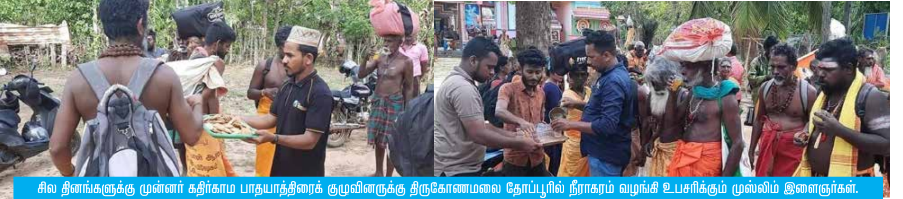
சில தினங்களுக்கு முன்னர் கதிர்காம பாதயாத்திரைக் குழுவினருக்கு திருகோணமலை தோப்பூரில் நீராகரம் வழங்கி உபசரிக்கும் முஸ்லிம் இளைஞர்கள்.

ஒற்றுமையற்று, நோக்கங்களில் தீர்க்கதரிசனம் இல்லாமல், அங்கு ஓர் அமைப்பு தாங்கள் நினைத்த விதத்தில் ஒரு மின்னஞ்சலும், இன்னொரு அமைப்பு வேறொன்றும், சில வாண வேடிக்கைகளும், 'நாட்டை பிரிக்க ஐக்கிய நாடுகள் ஸ்ரீலங்காவுடன் பேச்சுவார்த்தைகளில் ஈடுபட்டால் நாட்டிற்குரிய கடன்களை தமிழ் புலம்பெயர் சமூகம் அடைத்து விடும்' என்ற பீற்றல்களும் எதுவும் நடக்கப் போவதில்லை. தமிழ் மக்கள் நீதிக்காக தொடர்ந்தும் சர்வதேச அழுத்தங்கள் தந்து கொண்டே இருக்க வேண்டும். அவை தமிழ் மக்களை மையப்படுத்த