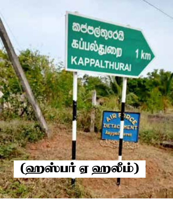
(ஹஸ்பர் ஏ ஹலீம்)

திருகோணமலை மாவட்டத்தில் உள்ள திருகோணமலை பட்டினமும் சூழலும் பிரதேச செயலகத்துக்கு உட்பட்ட கிராமமே கப்பல்துறை கிராமம். கண்டி - திருகோணமலை பிரதான வீதியில் இருந்து சுமார் ஒரு கிலோ மீற்றர் தொலைவில் இந்தக் கிராமம் அமைந்துள்ளது. மக்களின் அன்றாட ஜீவனோபாய தொழிலாக கூலித் தொழில், மழையே நம்பிய விவசாயம், வீட்டுத் தோட்ட பயிர்ச் செய்கையே சிறந்து விளங்குகின்றது. ஆனாலும் ஆரம்ப காலம் தொட்டு வாழ்ந்து வந்த இந்தக் கிராம மக்களின் பூர்வீகத்தை தற்போது துறைமுக அதிகார சபைக்கு சொந்தமான காணி எனக்கூறி குடியிருப்புக்களை விட்டு வெளியேறுமாறும் கூறி வரும் துறைமுக அதிகார சபையினரின் எச்சரிக்கையால் அந்தக் கிராம மக்கள் அதிருப்திக்கு உள்ளாக்கப்பட்டுள்ளார்கள்.