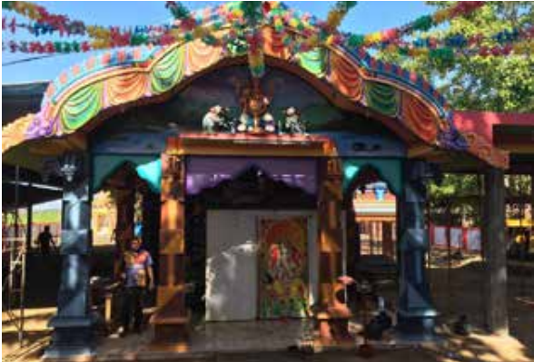
(காரைதீவு நிருபர் சகா)

வரலாற்றுப் பிரசித்தி பெற்ற கல்முனை மாநகர் நற்பிட்டிமுனை அருள்மிகு ஸ்ரீ அம்பலத்தடிவிநாயகர் தேவஸ்தான மகா கும்பாபிஷேக பெருஞ் சாந்தி நிகழ்வின் எண்ணெய்க் காப்பு சாத்தும் வைபவம் நாளை மறுதினம் செவ்வாய்க்கிழமை நடைபெற விருக்கிறது. அன்று காலை 5 மணி முதல் மாலை 5 மணி வரை எண்ணெய்க் காப்பு சாத்தும் நிகழ்வு இடம்பெறும்.