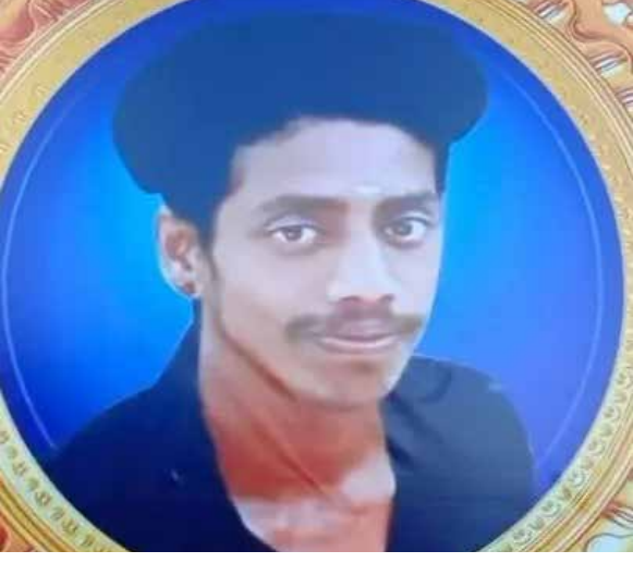
மண்டபம் அகதிகள் முகாமில் இருந்த இலங்கைத் தமிழ்க் குடும்பத்தைச் சேர்ந்த இளைஞர் ஒருவர்.

கைப்பேசியில் கேம் விளையாடுவதை தாய்கண்டித்தமையால் தற்கொலை செய்துகொண்டுள்ளார் என செய்திகள் வெளியாகியுள்ளன.