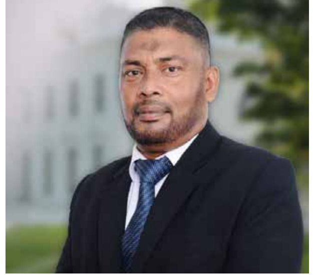
களை இல்லாமல் செய்து நல்லிணக்கம், இன நல்லுறவுகளை வளர்க்கும் முயற்சிகள் எடுக்கப்பட வேண்டும். - எனக் குறிப்பிடப்பட்டுள்ளது.