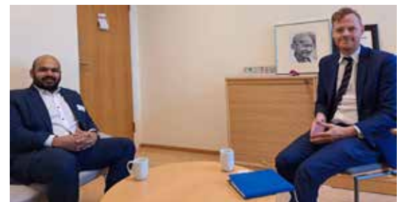
கான தீர்வுகள் தொடர்பிலும் கலந்துரையாடப்பட்டது.

இதன்போது இலங்கையில் தற்போது நிலவும் பொருளாதார நெருக்கடிகள், அதனால் ஏற்பட்டுள்ள அரசியல் நெருக்கடிகள் தொடர்பிலும், இவற்றுக்