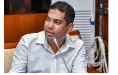
இருக்க வேண்டும் என்றும் அமைச்சர் தெரிவித்துள்ளார். (ஐ)

இல்லாமல் தங்குவதைத் தடுப்பதற்காக இந்தத் தீர்மானம் எடுக்கப்பட்ட போதிலும், தற்போது இந்த டோக்கன் முறைமை, ஐ. ஓ. சி. எரிபொருள் நிரப்பு நிலையங்களுக்கு அருகில் வியாபாரமாக மாறியுள்ளது. எனவே, இது விடயத்தில் மக்கள் விழிப்பாக