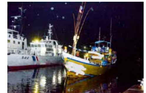
துறை நீதிவான் நீதிமன்றில் முற்படுத்தப்படவுள்ளனர். (ஐ)

இவ்வாறு கைதுசெய்யப்பட்ட மீனவர்கள் இன்று திங்கட்கிழமை பருத்தித்