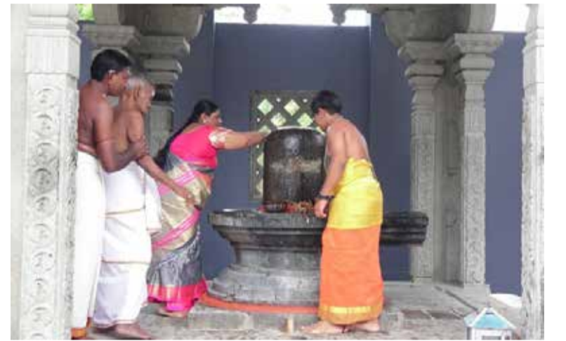
டன் எண்ணெய்க் காப்பு சாத்தும் நிகழ்வு நிறைவடையும். பின்னர் கிரியைகள் இடம்பெற்று 6 ஆம் திகதி

தொடர்ந்தும் இன்று திங்கட்கிழமை 4 ஆம் மற்றும் 5 ஆம் திகதி நண்பகல் 12 மணிய