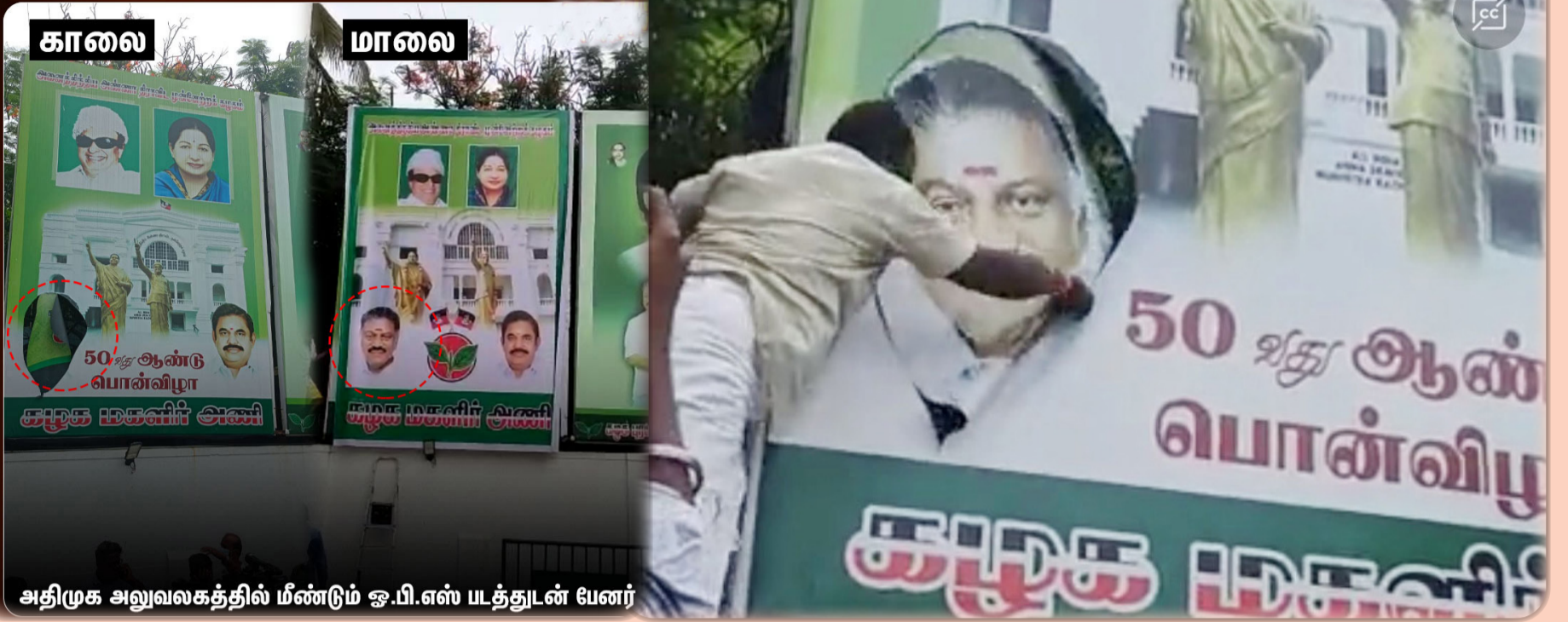
அதிமுக அலுவலகத்தில் மீண்டும் ஓ.பி.எஸ் யடத்துடன் பேனர்