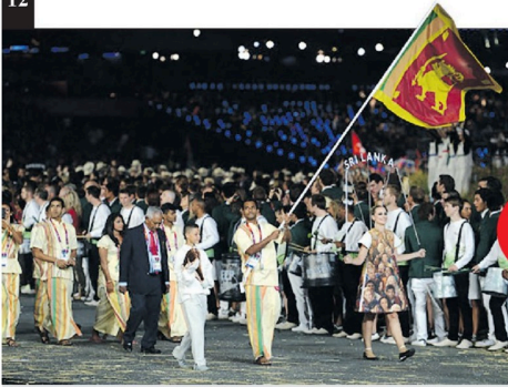
2022ஆம் ஆண்டுக்கான பொதுநலவாய விளையாட்டு விழா இங்கிலாந்தின் போர்பிங்ஹாம் நகரில் ஜூலை 28ஆம் திகதிமுதல் ஒகஸ்ட்