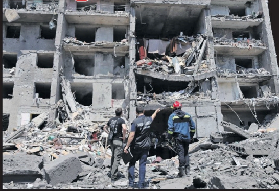
விடுகளும் சேதமடைந்துள்ளன. எனினும், எத்தனைபேர் உயிரிழந்தனர் என்பது தொடர்மான விபரங்களை ரஷ்ய அரசாங்கம் வெளியிடவில்லை.

மேலும், ரஷ்யாவின் பெல்ஹோரோட் நகரத்தின் மீது உக்ரைன் படையினர் நடத்திய தாக்குதலில் 11 தொடர்மாடிகளும் 39 தனி