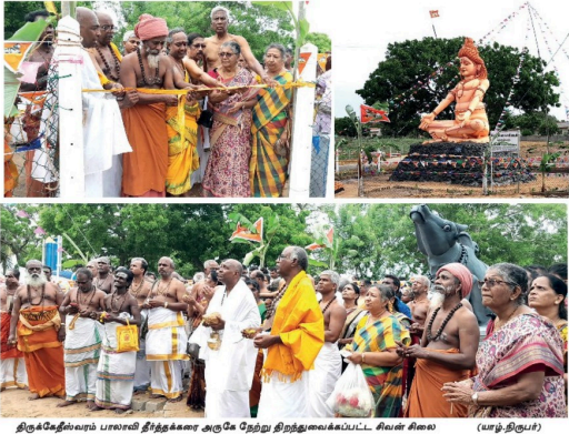
திருத்தலத்தின் மடு அண்மையின் ஆடித் திருவிழா நேற்று முன்தினம் இடம்பெற்றது. (யாழ். திருபுர)