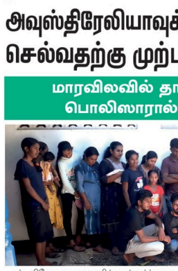
சட்டவிரோதமான குழுவில் உட்பார்வையாளர் அலுவலரிடமிருந்து கைது செய்யப்பட்டுள்ளார்.

இதன்போது, 132 சட்டவிரோத மதுபான உற்பத்தி இடங்கள், 127 சட்டவிரோத மதுபான விற்பனை இடங்கள், 66 ஆயிரத்து 87 பதுக்கங்கள், ஆயிரத்து 626 மதுபான போக்குவரத்து ஆயிரத்து 689 சட்டவிரோத மதுபான விற்பனை ஆகியவை முற்றாக அடையப்பட்டுள்ளன. மேலும், சட்டவிரோதமாக போதைப்பொருள் கைது செய்யப்பட்டுள்ளனர். இவர்களில் 03 ஆயிரத்து 987 சுற்றிவளைப்பில் 1,881 பெண்கள் என அதிகாரிகள் தெரிவித்துள்ளார்.