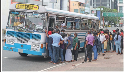
எரிபொருள் நெருக்கடி காரணமாக நேற்றைய தினம் சுமார் 1000 பஸ்களே நாட்டளவிய நிலையில் சேவையில் ஈடுபட்டதாக தெரிவிக்கப்படுகிறது. நேற்று கொழும்பில் பயணிகளால் நிரம்பி வழிந்த பஸ் இது...

நாட்டில் ஏற்பட்டுள்ள மோசமான எரிபொருள் தட்டுப்பாட்டினால், கொழும்பில் உள்ள வெளிநாட்டுத் தூதரகமொன்று கடுமையாக பாதிக்கப்பட்டிருந்ததாக தெரியவருகிறது. அதேபோல் பல தூதரகங்கள் சேவைகளை குறைத்து வருவதாகவும் செய்திகள் வெளிவந்துள்ளன. 02 பக்கம்