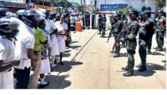
புறம்போக்கு அண்மையின் ஆடித் திருவிழா நேற்று முன்தினம் இடம்பெற்றது. (யாழ். திருபுர)

(கைது ஆரசு முதியோர் இல்லம்) இவ்வகை மருந்துப் பொருள் விநியோகம் தொடர்பாக மறிமுடிபுகளை ஏற்பாடுசெய்து தரமுறை யாழ். வணிக ஆக பிரதிநிதிகள் கேட்டுக்கொண்டதற்கிணங்க போக்குவரத்து மற்றும் நெடுஞ்சாலைகள் அமைச்சர் பந்துல குணவர்தனலிடம் அங்கலுன் இராமநாதன் கடிமம் மூலம் கோரிக்கை முன்வைத்துள்ளார்.