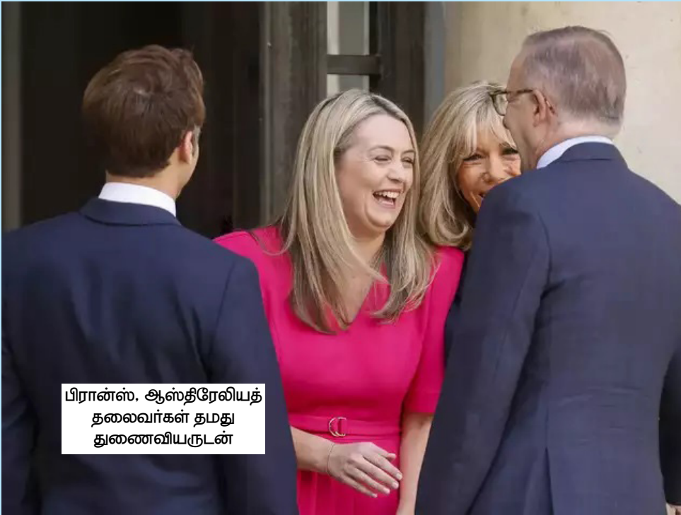
பிரான்ஸ், ஆஸ்திரேலியத் தலைவர்கள் தமது துணைவியருடன்

முந்தைய ஆஸ்திரேலிய பிரதமர் ஸ்காட் மோரிசன், அமெரிக்கா வடிவமைத்த நீர்மூழ்கிக் கப்பல்களை வாங்க இரகசியமாக பேச்சுவார்த்தை நடத்தி, 2016 இல் பிரான்ஸுடன் கையெழுத்திட்ட ஐயாயிரம் கோடி ஆஸ்திரேலிய டொலர்கள் (3,300 கோடி யுரோக்கள்) நீர்மூழ்கிக் கப்பல் ஒப்பந்தத்தை கைவிட்ட பிறகு நட்பு நாடுகளான