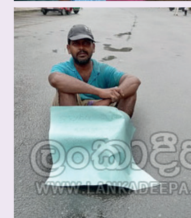
பிள்ளைகளுக்கு பால் மட்டுமல்ல, தன்னுடைய குடும்பத்தில் சகலருக்கும் நாளாந்தம் சூவேளையும் சாப்பிடுவதற்கு ஒன்றுமே இல்லை. எனக்கு வேலைக்கிடைப்பதில்லை

என்பதால், பிள்ளைகளை வளர்க்கமுடியவில்லை” என்றார். பிரதான வீதியில் அமர்ந்திருந்தவரின் அருகில் சென்று பொலிஸார் விசாரித்தனர். அதன்பின்னர், அங்கு குழுவியிருந்தவர்கள் இன,மத,மொழி பேதங்களை மறந்து, தங்களால் இயன்ற உதவிகளைச் செய்தனர். கிடைத்த உதவிகளைக் கொண்டு, அந்நபருக்கு தேவையான பொருட்களை பொலிஸாரும், பொதுமக்களும், வர்த்தகர்களும் பெற்றுக்கொடுத்தனர்.