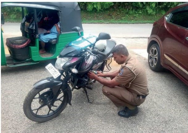
போதே, மேற்படி சம்பவம் நேற்று (04) இடம்பெற்றுள்ளது. சீருடையில் இருந்துகொண்டு பல்வேறான மோசடிகளில் ஈடுபடுபவர்களுக்கு மத்தியில் மனிதாபிமானத்துடன் செயற்படும் இவ்வாறான அதிகாரிகளும் இருக்கத்தான் செய்கின்றனர் என பிரதேசவாசிகள் புகழ்ந்துள்ளனர்.

கர்ப்பிணி தாயொருவரை வைத்தியசாலைக்கு ஓட்டோவில் ஏற்றி சென்று கொண்டிருந்த போது, அந்த ஓட்டோவில் எரிபொருள் தீர்ந்துவிடவே, கலவான சபைக்கு முன்பாக இந்த எதிர்ப்பு ஆர்ப்பாட்டத்தை முன்னெடுத்தனர். லுணுகலை எரிபொருள் நிரப்பும் நிலையத்துக்கு முன்பாக, எரிபொருளை பெற்றுக் கொள்வதற்காக காத்திருந்த வாகன