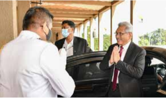
தனக்கு எதிரான மக்கள் போராட்டங்கள் தீவிரமடைந்ததை அடுத்து நீண்ட நாட்களாக வெளியே தலை காட்டாமல் இருந்து வந்த ஜனாதிபதி கோட்டாபய ராஜ

10 நிமிடங்களுக்குச் சபை அமர்வு ஒத்திவைப்பு