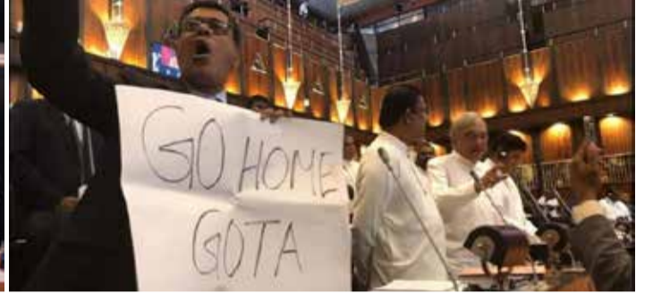
நிலையில், 10.05 மணியளவில் ஜனாதிபதி சபைக்குள் பிரவேசித்தார். இதன்போது நாட்டின் பொருளாதார