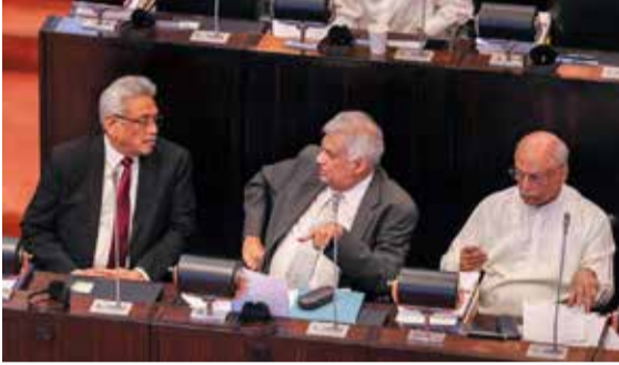
பக்ஷ, இன்று நாடாளுமன்ற அமர்வில் கலந்துகொண்டார். இன்று முற்பகல் 10 மணிக்கு நாடாளுமன்றம் கூடிய