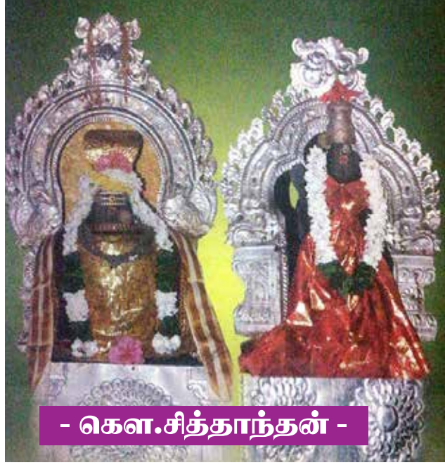
- கௌ.சித்தாந்தம் -