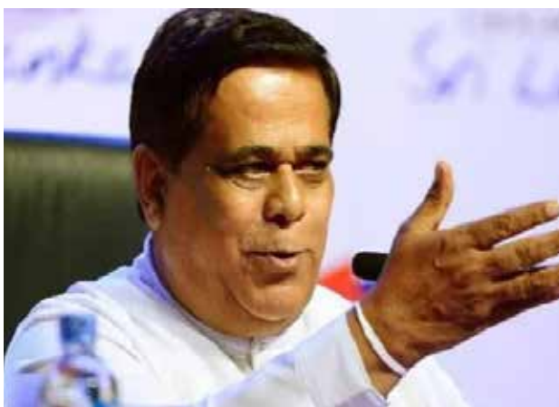
இலஞ்ச ஊழல் குற்றச்சாட்டு தொடர்பான விசாரணை முடியும் வரை தனது அமைச்சுப் பதவியை இராஜினாமா செய்கிறேன் என நிமல் சிறிபால டி சில்வா அறிவித்துள்ளார்.

எதிர்க்கட்சித் தலைவரின் குற்றச்சாட்டு தொடர்பில் ஜனாதிபதியின் பணிப்புரைக்கு அமைய விசாரணைகள் மேற்கொள்ளப்படவுள்ளன.