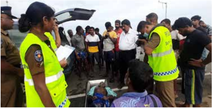
(கலையமுதன்) யாழ்ப்பாணம், ஜூலை 07 யாழ்ப்பாணம் பண்ணை கடற்கரைப் பகுதியில் முதியவரின் ஒருவரின் சடலம் நேற்றைய தினம் மீட்கப்பட்டுள்ளது.