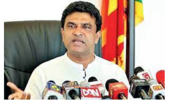
மைத்துவமாகக் கொண்டு எப் பிரச்சினைகளுக்கும் தீர்வு காண முடியாது.

கொள்கைக்கு முரணாக செயற்படுகிறார்கள். நாடு தீப்பற்றி எரியும் வகையில் நெருக்கடிகளை தீவிரப்படுத்திய ஜனாதிபதி கோட்டாபய ராஜபக்ஷவை தலை