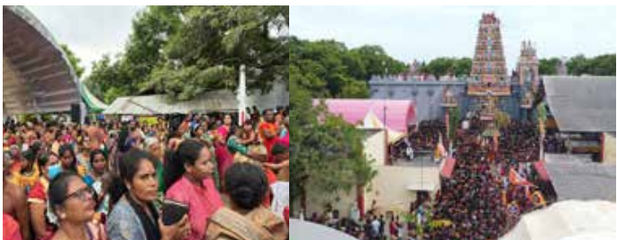
(ந.லோகதயாளன்) நானாட்டான், ஜூலை 07 பஞ்ச ஈச்சரங்களில் ஒன்றான பாடல் பெற்ற திருத்தலமான மன்னார் திருக்கேதீஸ்வரம் ஆலயத்தின்