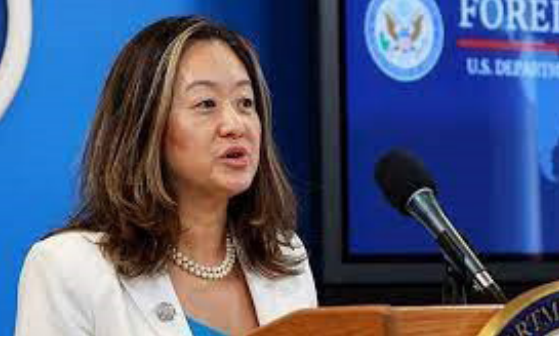
இலங்கையில் சட்டத்தின் ஆட்சியை வலுப்படுத்துவதற்கு நீதியமைச்சால் முன்னெடுக்கப்பட்டுவரும் முயற்சிகளுக்குப் பங்களிப்புச்செய்யும் நோக்கில் சர்வ

இலங்கைக்கான அமெரிக்கத்தூதுவர் ஜூலி சங் சுட்டிக்காட்டு