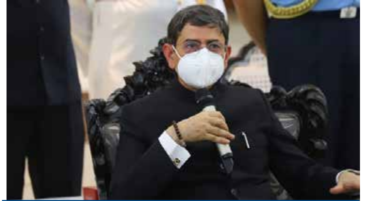
சிப்பாய் எழுச்சி நாள்: கவர்னர் ரவிநாளை வேலூரில் அஞ்சலி செலுத்துகிறார்

உடனே அவரது ஆதரவாளர்களும் சுங்கச்சாவடியில் உள்ள கட்டண நுழைவாயில்களில் ஆங்காங்கே கார்களை அடுத்தடுத்து நிறுத்தியுள்ளதோடு மறியலிலும் ஈடுபட்டனர். இதனால் தங்களை தாக்கி விடுவார்கள் என்று பயந்து