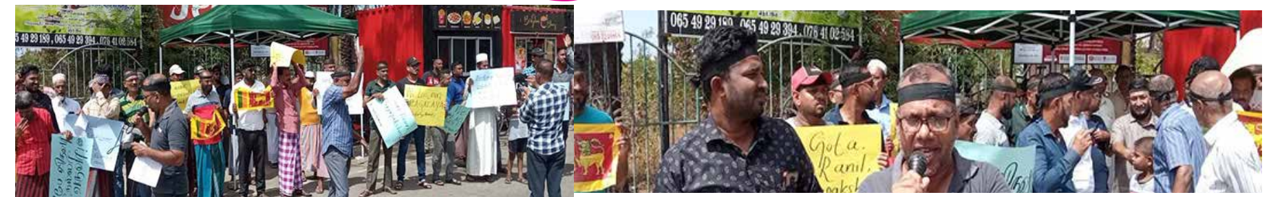
ஜனாதிபதி கோட்டாபாய ராஜபக்ஷவை பதவி விலகுமாறு வலியுறுத்தி கொழும்பில் இடம்பெறும் ஆர்ப்பாட்டத்திற்கு வலு சேர்க்கும் வகையில், திருகோணமலை - சேருநுவர பகுதியில், மட்டக்களப்பு - கல்முனை பிரதான வீதியில், காத்தான்குடியில், நேற்று சனிக்கிழமை காலை ஆர்ப்பாட்டமொன்று முன்னெடுக்கப்பட்டது.