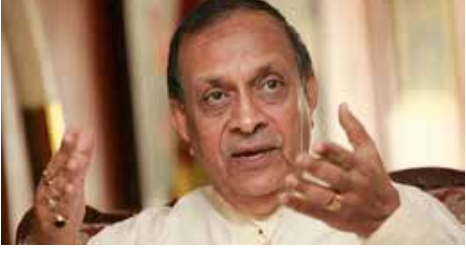
ராகவே இருக்கின்றார் என்று தெரியவருகின்றது.

முன்னாள் சபாநாயகர் கரு ஜயசூரியவை மீண்டும் நாடாளுமன்றம் வரவைப்பதற்கான ஏற்பாடுகள் இடம்பெறுகின்றன எனத் தகவல்கள் வெளியாகியுள்ளன.