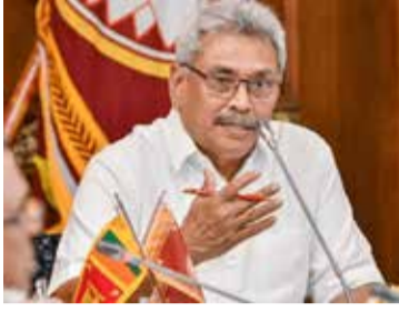
கலந்துரையாடி விரைவான தீர்மானத்தை எடுப்பதற்காக பிரதமர் ரணில் விக்கிரமசிங்க அவசர கட்சித் தலைவர்கள்

கொழும்பு, ஜூலை. 10 பிரதமரால் கூட்டப்படும், கட்சித் தலைவர்கள் கூட்டத்தில் எடுக்கப்படும் எந்தவொரு தீர்மானத்துக்கும் மதிப்பளிப்பதாக ஜனாதிபதி கோட்டாபாய ராஜபக்ஷ பிரதமர் ரணில் விக்கிரமசிங்கவிடம் தெரிவித்துள்ளார்.