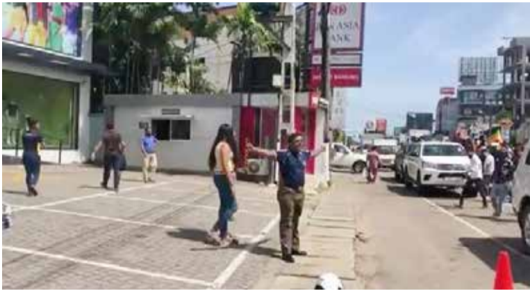
மஹரகமவில் வைத்தே, போராட்டக்காரர்களுடன் குறித்த பொலிஸ் அதிகாரி இணைந்துக்கொண்டுள்ளார். பொலிஸ் மோட்டார் சைக்கிள் அவ்விடத்திலேயே

கொழும்பு, ஜூலை. 10 மோட்டார் சைக்கிளில் வந்து கொண்டிருந்த போக்குவரத்து பொலிஸார் ஒருவர், மோட்டார் சைக்கிளை நிறுத்தி விட்டு போராட்டத்தில் இணைந்துக்கொண்ட சம்பவ மொன்று பதிவாகியுள்ளது.