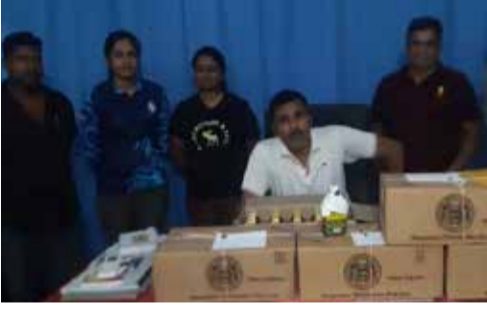
மட்டக்களப்பு, ஜூலை. 11 மட்டக்களப்பு தலைமையக பொலிஸ்

பிரிவிலுள்ள குமாரபுரம் புன்னைச்சோலை பகுதியில் சட்டவிரோத மதுபான விற்பனை நிலையத்தை நேற்று முன் தினம் முற்றுகையிட்ட பொலிஸார், அதை நடத்தி வந்த 45 வயதுடைய பெண் ஒருவரை கைது செய்துள்ளனர். இதன்போது, கால் போத்தல் கொண்ட மதுபானப் போத்தல்கள் 126 கைப்பற்றப்பட்டதாக, மாவட்ட குற்ற விசாரணைப் பிரிவு பொறுப்பதிகாரி பி.எஸ்.பி. பண்டார தெரிவித்தார். (அ)