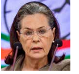
போதைய அரசியல் சூழல் குறித்து காங்கிரஸ் கட்சி

சோனியா காந்தி வருத்தம் கொழும்பு, ஜூலை. 11 இந்த நெருக்கடியான தருணத்தில் இலங்கைக்கு உதவுமாறு சர்வதேசத்தை இந்திய காங்கிரஸ் கட்சி கேட்டுக்கொள்கிறது என சோனியா காந்தி தெரிவித்துள்ளார். அவர் வெளியிட உள்ள அறிக்கையில் இந்த விடயம் தெரிவிக்கப்பட்டுள்ளது. இலங்கையின் தற்