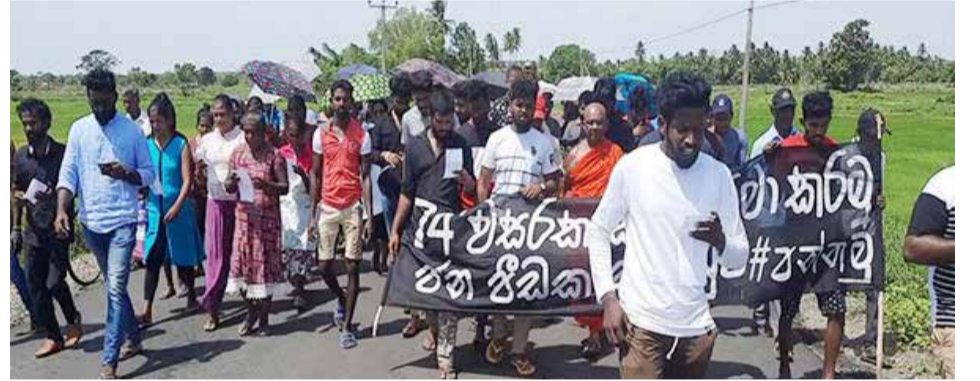
மட்டக்களப்பு, ஜூலை. 11 ஜனாதிபதி கோட்டாபாய ராஜபக்ஷவை பதவி விலகுமாறு வழியறுத்தி கொழும்பில் இடம்பெறும் ஆர்ப்பாட்டத்திற்கு வலு சேர்க்கும் வகையில், திரு

கோணமலை - சேருநுவர பகுதியில், மட்டக்களப்பு - கல்முனை பிரதான வீதியில், காத்தான்குடியில் நேற்று முன் தினம் சனிக்கிழமை காலை ஆர்ப்பாட்டம் மொன்று முன்னெடுக்கப்பட்டது.