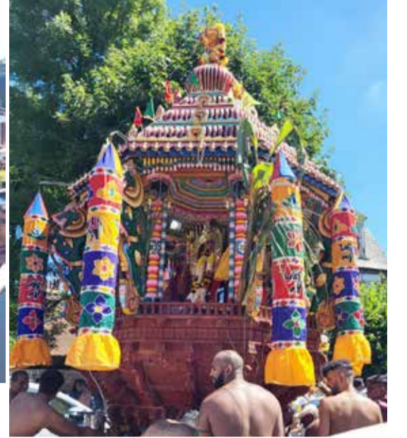
லண்டன் ஆர்ச்வேயில் உள்ள உயர் வாசற்குன்று முருகன் ஆலயத்தின் வருடாந்த தேர்த் திருவிழா நேற்று சிறப்பாக இடம்பெற்றது. இதில் பெரும் எண்ணிக்கையான புலம்பெயர் தமிழர்கள் பங்கேற்றனர். (அ)