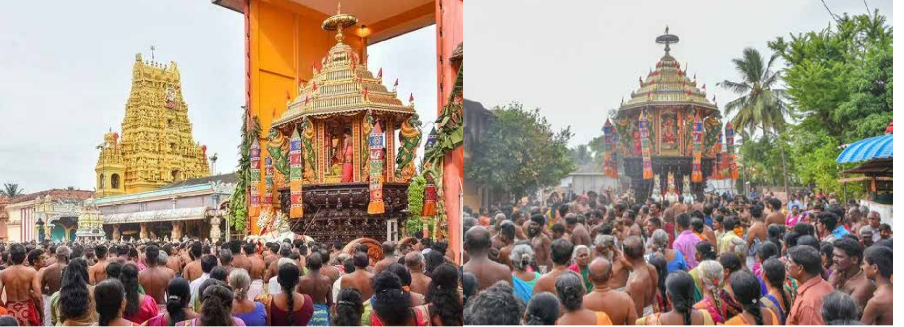
யாழ்ப்பாணம் - வண்ணார்பண்ணை ஸ்ரீ வீரமாகாளி அம்மன் கோவில் தேர்த் திருவிழா இன்று (செவ்வாய்க்கிழமை) காலை பக்தி பூர்வமாக இடம்பெற்றது. இதில் அதிகளவான பக்த அடியார்கள் பங்கேற்றிருந்தனர்.