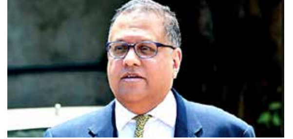
என மகேந்திரன் தெரிவித்துள்ளார்.

புதிய நிதிகளைப் பெற்றுக்கொள்வதன் மூலம் அந்நியசெலாவணி இல்லாத பிரச்சினைக்குத் தீர்வை காணவேண்டும். கடந்தகாலத்தில் பெருமளவு கடன்களைப் பெற்றுள்ளதால் கடன்கள் குவிந்துள்ளதால் இலங்கை அரசாங்கம் நிதி வழங்குநர்கள் தனக்கு நிதி வழங்கச் செய்வதில் பெரும் நெருக்கடியை எதிர்கொண்டுள்ளது. இந்தியா கூட புதிய நிதியை வழங்கத் தயங்குகின்றது