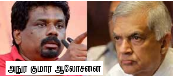
அநூர குமார ஆலோசனை

பிரதமர் ரணில் விக்கிரமசிங்க என்கிற தனிமனிதரின் பதவிப் பேராசைக்காக நாட்டையும், நாட்டு மக்களையும் பலிகொடுக்க வேண்டாம் என மக்கள் விடுதலை முன்னணியின் தலைவர் அநூரகுமார தீஸாநாயக்க தெரிவித்துள்ளார்.