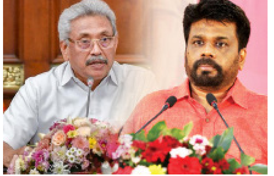
மேலும், சில நாடாளுமன்ற உறுப்பினர்களை விலைக்கு வாங்கி பெரும்பான்மையுடன் நாடாளுமன்றத்தில் புதிய ஜனாதிபதியாகத் தெரிவு செய்யப்பட்ட பிரதமர் விக்கிரமசிங்க சதி செய்கிறார் எனவும் அவர் குற்றம் சுமத்தியுள்ளார்.