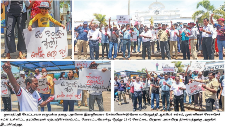
ஜனாதிபதி கோட்டைய ராஜபக்ஷ தனது பதவியை இராஜினாமா செய்வதற்கான வலியுறுத்தி ஆசிரியர் சங்கம், முன்னிலை சேரவேகி கட்சி உள்பட தரப்பினரால் ஏற்படுத்தப்பட்ட போராட்டமொன்று நேற்று (14) கோட்டை பிரதான புகையிரத நிலையத்துக்கு அருகில் இடம்பெற்றது.