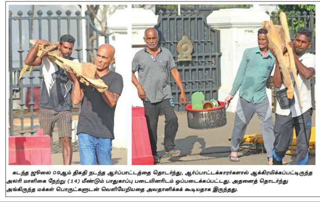
கடந்த ஜூலை 09ஆம் திகதி நடந்த ஆர்ப்பாட்டத்தின் போது, ஆர்ப்பாட்டக்காரர்களால் ஆக்கிரமிக்கப்பட்டிருந்த அலரி மாளிகை நேற்று (14) மீண்டும் பாதுகாப்புப் படைகளிடம் ஒப்படைக்கப்பட்டது. அதனை நொன்று அங்கிருந்த மக்கள் பொருட்களின் வெளிப்போக்கு அடங்கியிருந்தது.

யாழ்ப்பாணம், கந்தர்மடப் பகுதியில் நேற்று இடம்பெற்ற புகையிரத விபத்தில் ஒருவர் உயிரிழந்துள்ளதாக பொலிவார் தெரிவித்தனர். கந்தர்மடப் பகுதியில் இருந்த புகையிரத வட்டமையில் நேற்று (14) மதியில் இந்த விபத்து இடம்பெற்றது. சம்பவம் தொடர்பில் யாழ்ப்பாணப் பொலிவார் விசாரணைகள் முன்னெடுத்துள்ளனர். பரதசாப்பற்ற புகையிரதக் கடலையில் உயிரிழந்தவரின் மரோதன் அடர் இவ்வாறு தெரிவித்தனர். எம்சேஎனதுமறையிலிருந்து யாழ்ப்பாணப் பொலிவார் மேற்பார்வை குறித்த நபர் உயிரிழந்துள்ளதாக தெரிவிக்கப்பட்டுள்ளது.